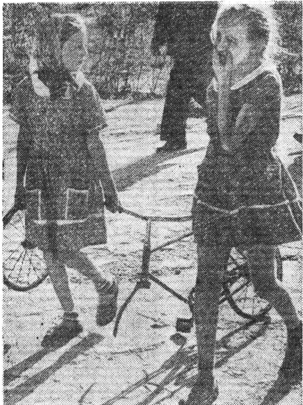
После велосипедной аварии или... «нам сегодня попадет».