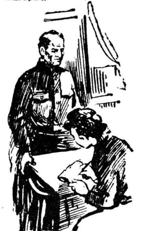
Очерк «Страницы жизни» читайте на 2, 3 и 4 страницах.