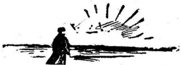
Рис. худ. Н. Сухорукова.