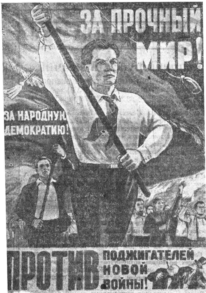
Плакат работы художника П. Голубь, выпущенный издательством «Искусство».