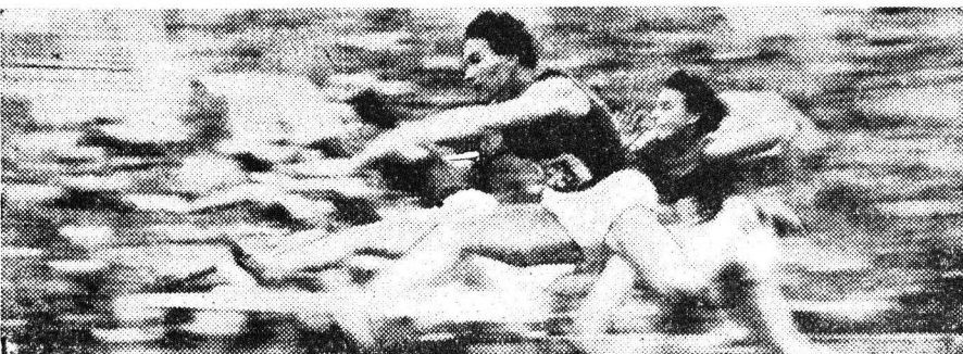
«Слово плыви». (На третьей Весенней художественной фотовыставке «Семилетка в действии» 1962 года О. Неселову присужден диплом второй степени).