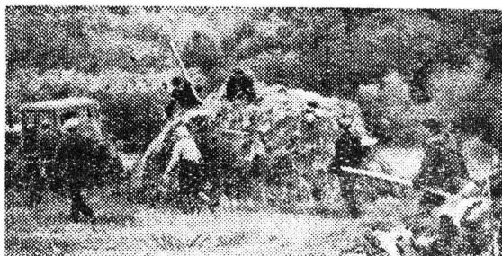
Трактор направляется к бургу.