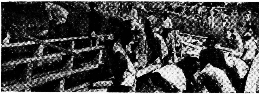
ГВИНЕЙСКАЯ РЕСПУБЛИКА. Строительство стадиона на 25 тысяч мест в Комакри.