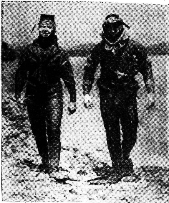
Вот они, спортсмены-аквалангисты.