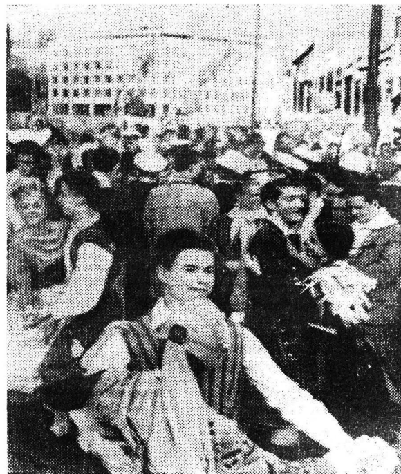
ХЕЛЬСИНКИ. На улицах города в день открытия VIII Всемирного фестиваля молодежи и студентов.

Прием прошел в дружественной обстановке.