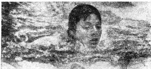
Фото К. Мевалда (ЧТК—ТАСС). (Принято по фототелеграфу).

ХЕЛЬСИНКИ. VIII Всемирный фестиваль молодежи и студентов.