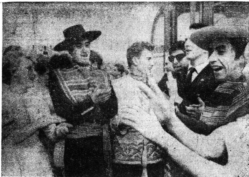
НА СНИМКЕ: советская и чилийская молодежь во время встречи.

ХЕЛЬСИНКИ. VIII Всемирный фестиваль молодежи и студентов.