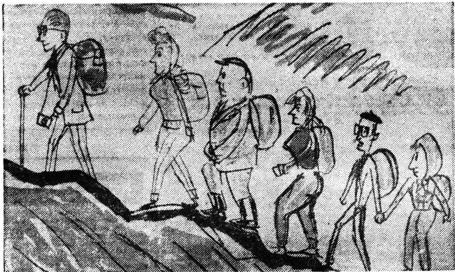
По крутым курильским тропам...

АРЫК-БАЛЫК. (Коммунальная область). (ТАСС). На многие километры уходят вдали волны Имантава, и ласковый прибой озера поет лютым своим вечную песню. Вдали видны очертания села. А здесь, у самого берега озера — еще один поселок. В стороне висит маяк, на мачте красный флаг. Нет, это не пионерский лагерь и не туристская база. Здесь расположен полевой стан комсомольско-молодежной ученической бригады Имантавской одиннадцатилетней школы, в которой трудятся 26 старшеклассников. Трудолюбивые, полные энергии, они имеют право трактористов. Половина может работать в комбайнерами.