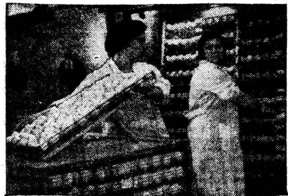
МОСКОВСКАЯ ОБЛАСТЬ. На Центральной испытательной инкубаторной станции в городе Пушкино разрабатываются новые конструкции инкубаторов и различные устройства по механизации трудоемких

процессов в птицеводстве. НА СНИМКЕ: новый инкубатор «Универсал-65», проходящий испытания.