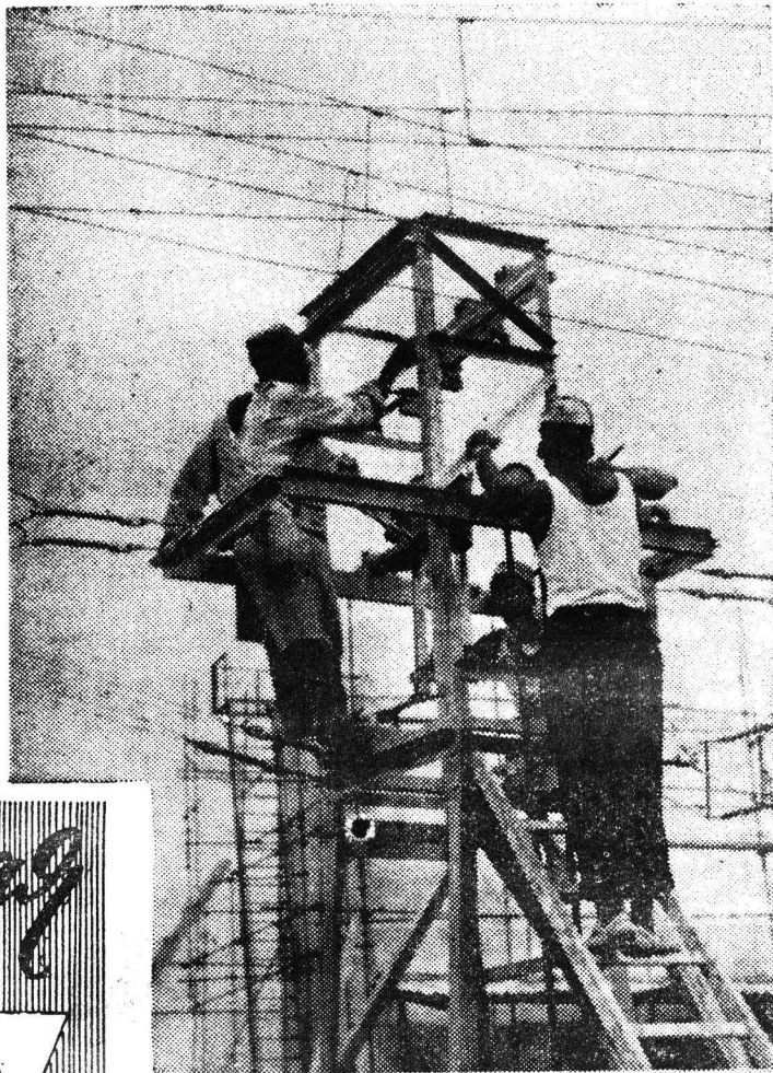
В Гвинейской Республике проходят последние испытания радиостанции «Голос революции», построенной с помощью Советского Союза близ гвинейской столицы Конакри. С пуском второй очереди мощность станции составит 100 киловатт.

После чемпионата мира в Чили футбольная «биржа» заработала с новой силой. Баснословные суммы предлагают ведущие итальянские клубы за «звезды» Аргентины, Бразилии, Чили, Колумбии. Миллион долларов стоит сейчас ноги Пеле — лучшего нападающего бразильского клуба «Сантос». Однако посягательства на него со стороны итальянского клуба «Милан» были сразу же отклонены. Ответ на это предложение со стороны президента клуба «Сантос» Модесто Ромы был недвусмысленен: «Мы не продадим Пеле, поскольку он делает деньги для нас».