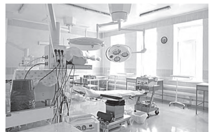
Операционные медучреждений модернизируются.

Затем в административном корпусе онкодиспансера состоялся круглый стол, на котором проанализировали ход реализации партийного про-