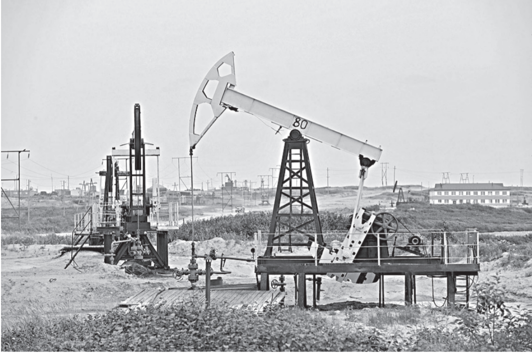
села Охинского «РН-Сахалинморнефтегаз»

Одновременно продолжают работу и на остальных месторождениях. В их числе — и такие сложные, как Катанги и Уйлекуты, где за последнее время построены 8 уникальных горизонтальных скважин. В целом же коллектив предприятия, несмотря на то, что разведанные запасы черного золота на острове эксплуатируются довольно давно и заметно истощились, поставил перед собой задачу: удержать добычу нефти на уровне 1,5 млн. тонн в год. При этом в «РН-Сахалинморнефтегазе» энергично работают и над эффективным использованием сопутствующего нефти газа. По словам С. Дряблова, например, на месторождении Одопту запустили