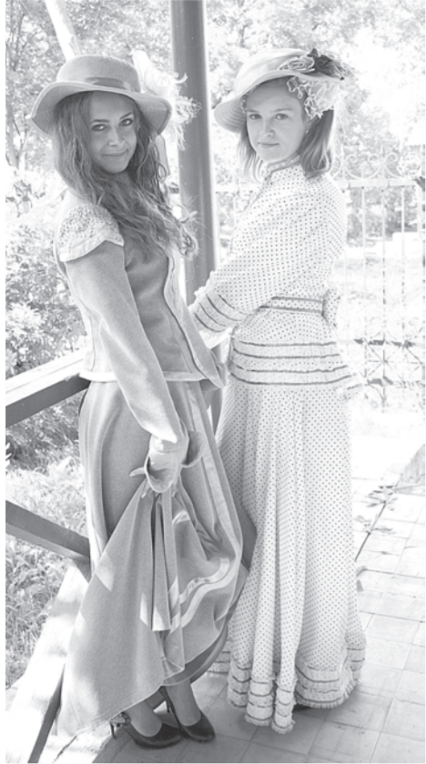
Путешествие во времени.

ОСЕНЬ — новый этап в жизни и работе этого учреждения. И прежде всего потому, что у школьников и студентов начинается новый учебный год, а в стенах музея — исследования филологов, творческие задания школьников, тематические встречи. Но первые дни осени все равно воспринимаются как маленькие праздники.