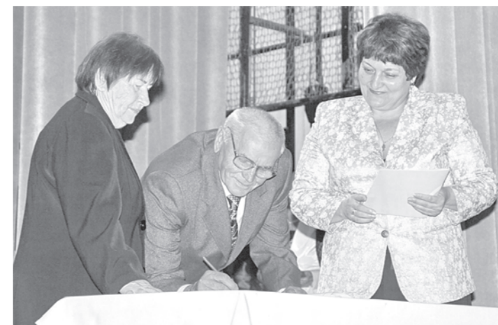
На сцене — юбиляры совместной жизни.