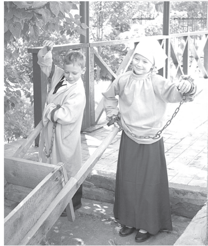
«Сонька Золотая Ручка» и «каторжанин».