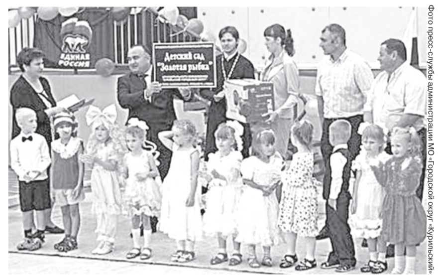
Иллюстрация: Юлия Яковлева/Фотобанка.ORG