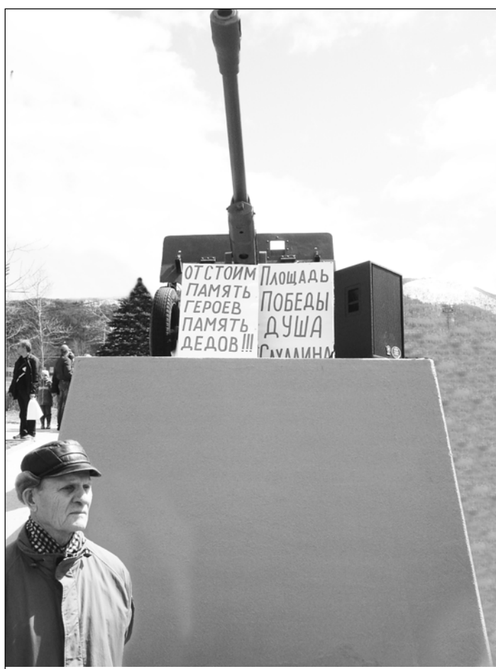
Общественность выразила свое отношение к символам Победы.