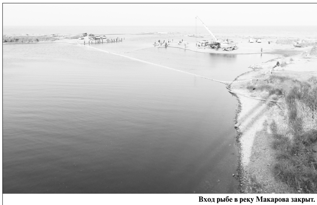
Вход рыбы в реку Макарова закрыт.

Доколе будет продолжаться это издевательство над