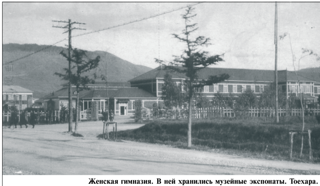
Женская гимназия. В ней хранились музейные экспонаты. Тохара.