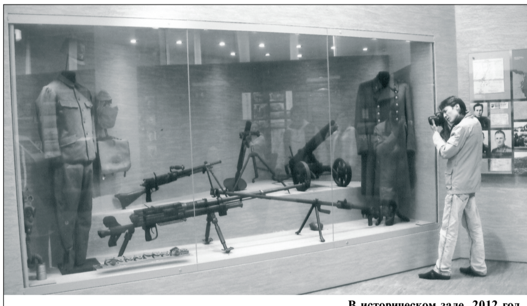
В историческом зале. 2012 год.