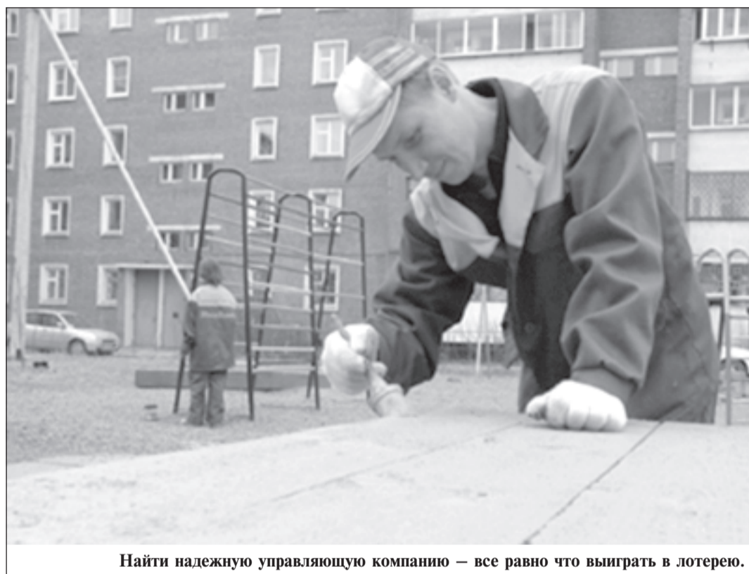
Найти надежную управляющую компанию — все равно что выиграть в лотерею.

Работники ООО «Жилищник» «восстанавливали» освещение в помещении тепловую узла дома № 83, хотя там полностью отсутствует электропроводка; «заменяли» на инженерных сетях задвижки таких диаметров, каких в домовых сетях и не бывало; «ремонти-