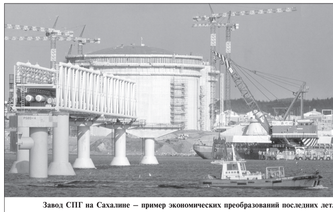
Завод СПГ на Сахалине — пример экономических преобразований последних лет.

Об инфраструктурной проблеме территорий генеральный директор и председатель правления компании «РУСАЛ» говорил и раньше. На VII Байкальском международ-