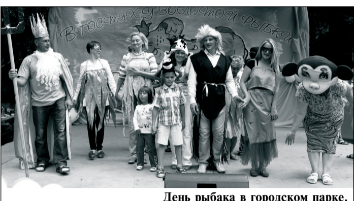
День рыбака в городском парке.

День рыбака южносахалинцы и гости города отметили праздничной программой в парке культуры и отдыха им. Ю. Гагарина. На поляне за тенистыми кортами развернулось настоящее морское представление с русалками неземной красоты и моряками в тельняшках. Для самых маленьких «рыбаков» работала игровая мягкая площадка. Праздничными узорами художник расписывал детские лица. А настоящим подарком малышам стало шоу мыльных пузырей.