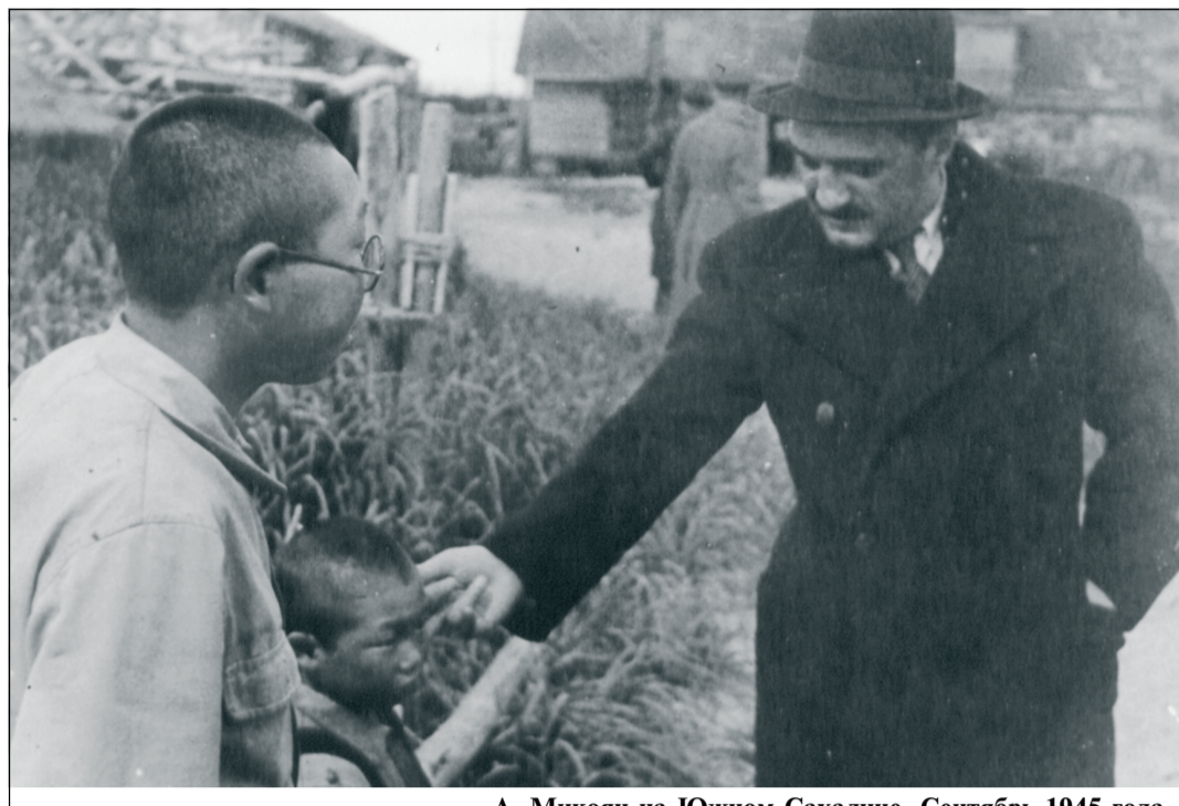
А. Микоян на Южном Сахалине. Сентябрь 1945 года.

(Продолжение. Начало в № 70, 76, 81, 83).