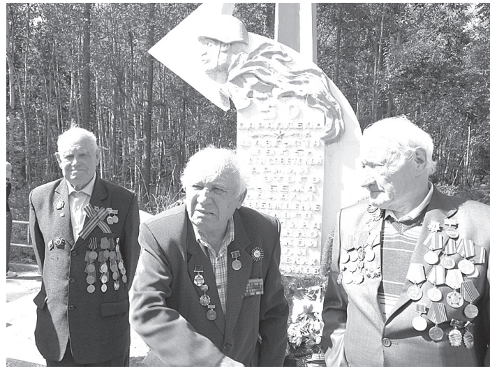
Ветераны у обелиска.

на», потом стали посещать места боев в Смирновском районе, что-то находить... Потихоньку все это переросло в поисковое движение.