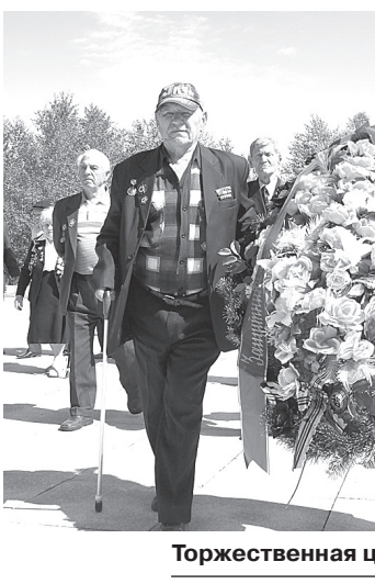
Торжественная церемония возложения венков.

Мы их таскали по сопкам летом и зимой, прыгали с парашютом. Сначала организовали военно-патриотический клуб «Сме-