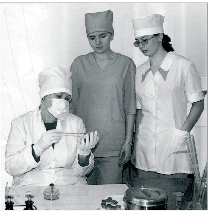
Сотрудники колледжа готовят студентов к будущей работе.

цевтической ассоциации направили областному департаменту здравоохранения письмо с просьбой открыть в колледже фармацевтическое отделение на базе среднего медицинского образования. Нам пришлось немало поработать в этом направлении, заключить договоры с преподавателями естественнонаучного факультета СаХГУ и специалистами аптек № 5, 107, 44 и 88 областного центра. Они предоставят свою базу для теоретических и практических занятий. В июле 2011-го колледж получил лицензию на оказание такой образовательной услуги, а в этом году состоялся первый набор — в фармацевты зачислены дипломированные фельдшеры, медсестры в количестве 32 человек. Как отрасль науки медицина сегодня развивается очень динамично. Не случайно в колледже всегда востребовано отделение повышения квалификации. Сюда за новыми знаниями, методиками и технологиями приезжают медики со всей области, чтобы подтвердить свой профессионализм. Здесь же проходят различные курсы повышения квалификации. Есть большой плюс в том, что медколледж территори-