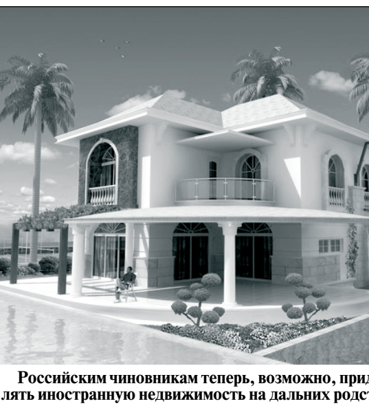
Российским чиновникам теперь, возможно, придется оформлять иностранную недвижимость на дальних родственниках.