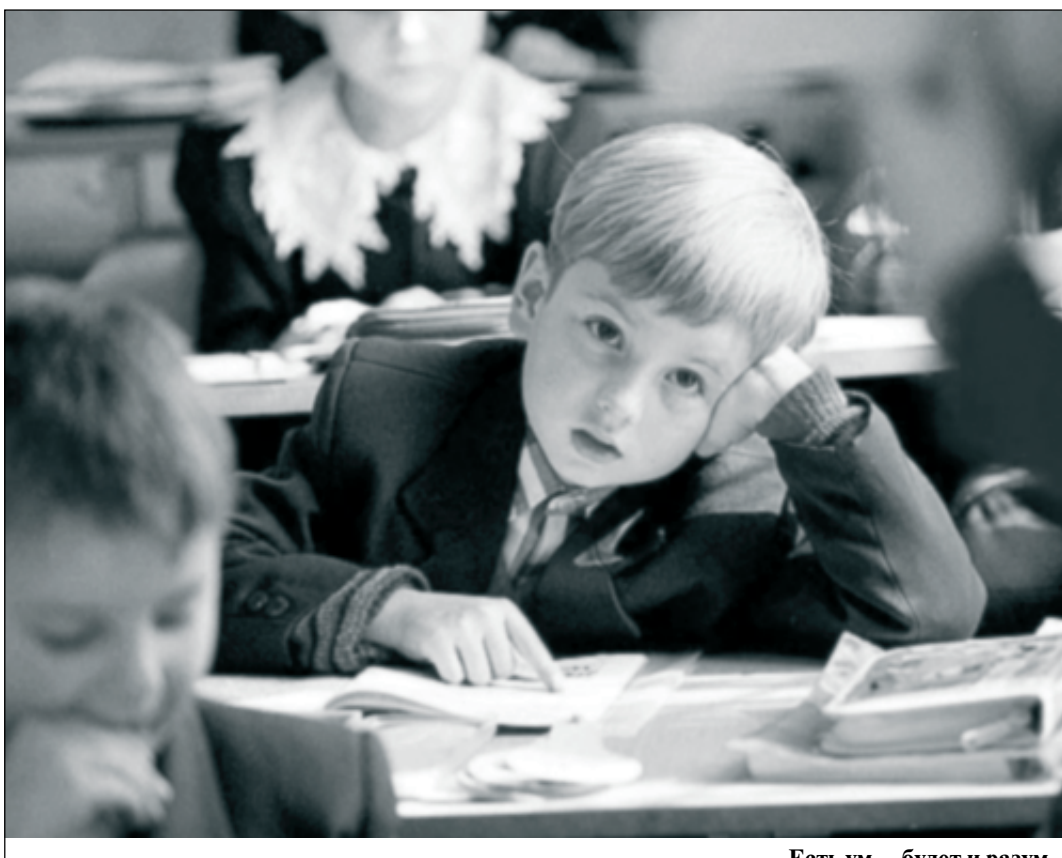
Есть ум – будет и разум.

Детвора узнает и о том, что с 1 сентября начинается декада, посвященная 67-й годовщине освобождения Южного Сахалина и Курильских островов от японских милитаристов. Можно активно поучаствовать в познавательных мероприятиях – акциях, эстафетах, викторинах, встречах с ветеранами войны и тружениками тыла, прикоснуться к героической истории родной земли.