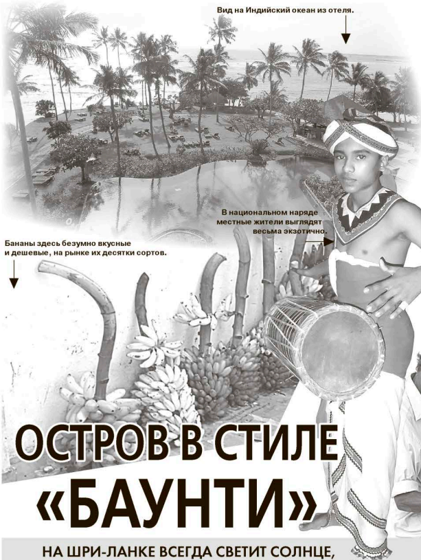
Вид на Индийский океан из отеля.