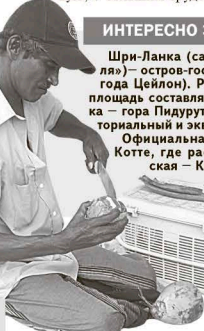
На пляже местные жители продают кокосы и другие фрукты.

Официальная столица — Джааяварденапуракотте, где расположен парламент, фактическая — Коломбо. Глава государства и правительства — президент. Официальные языки — сингальский и тамильский.