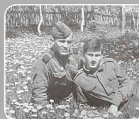
«Американский леток», Сахалин, 1967 г.