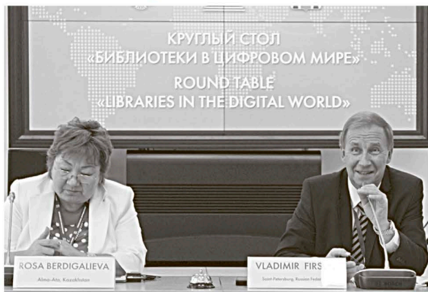
Ведущие — Роза Бердигалиева, президент библиотечной ассоциации Казахстана, и Владимир Фирс, президент Российской библиотечной ассоциации.

Более того, сегодня они тоже активно участвуют в строительстве информационного общества и стремятся оперативно ориентироваться на запросы читателей.