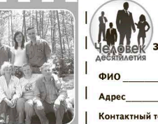
«В кругу друзей». 2007 г.