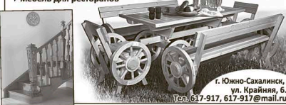
г. Южно-Сахалинск, ул. Крайняя, 6. Тел. 617-917, 617-917@mail.ru

Корпус и крышка модели выполнены из нержавеющей стали: дополнительная износостойкость, стильный внешний вид. Но главная особенность Moulinex Minut'Cook — умение готовить пищу под давлением. По сути, этот прибор сочетает в себе функции двух приборов: мультиварки и скороварки.