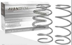
На правах рекламы.

Эксклюзивный дистрибутор в России компания ЮНИКОМ. Спрашивайте в магазинах города.