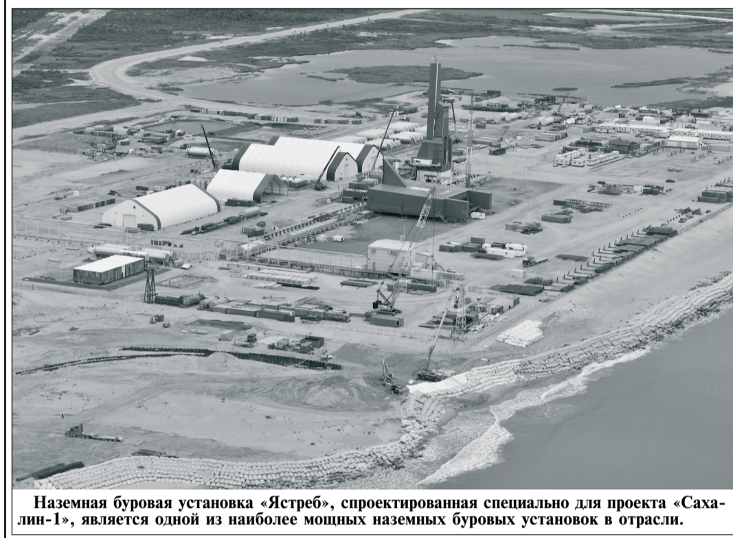
Наземная буровая установка «Ястреб», спроектированная специально для проекта «Сахалин-1», является одной из наиболее мощных наземных буровых установок в отрасли.