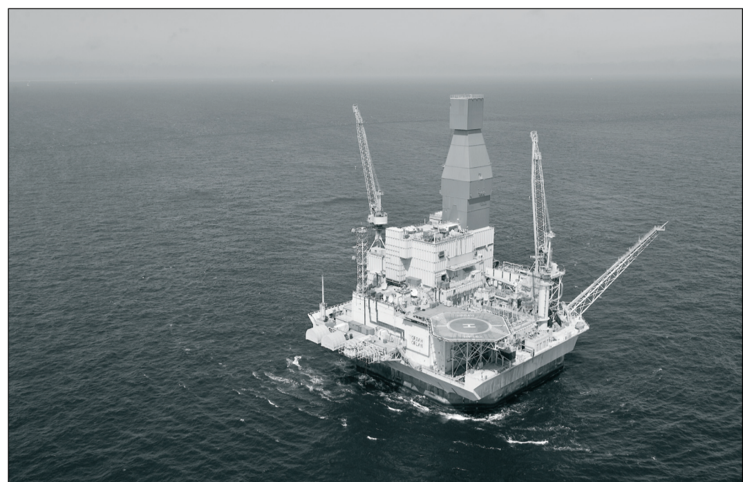
Платформа «Орлан» — пример уникального опыта проектирования, строительства и эксплуатации морской буровой техники.

Проект «Сахалин-1» имеет огромное значение для развития и самого острова, и всего Дальнего Востока России. Консорциум проекта «Сахалин-1» активно участвует в модернизации объектов общезональной инфраструктуры. Компания строит и обеспечивает современным оборудованием больницы, реализует проекты по строительству дорог и мостов. Большой объем работ был выполнен в аэропорту Ноглики, где были построены новые помещения аэровокзала, установлены современные всепогодные навигационные