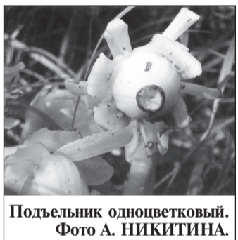
Поддельник одноцветковый.

В России встречается один из двух видов поддельника. Он полностью лишен хлорофилла и кажется вылепленным из воска. Растет в лесной подстилке — чаще у основания хвойных деревьев, но также встречается в смешанных и лиственных лесах. Цветы у поддельника одноцветкового удлиненной колокольчатой формы. Их венчик состоит из 4–5 лепестков. Это растение в народе также называют вертляницей.