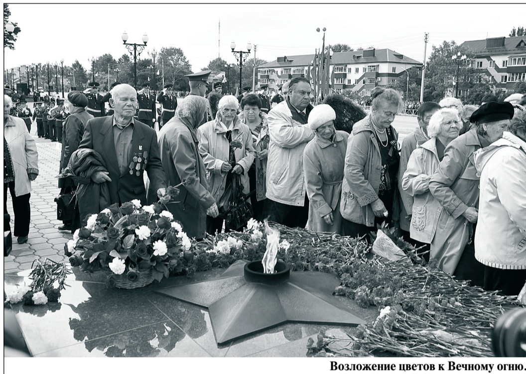
Возложение цветов к Вечному огню.

В Южно-Сахалинске 2 сентября прошли торжества, посвященные 68-й годовщине со дня окончания второй мировой войны и освобождения Южного Сахалина и Курильских островов.