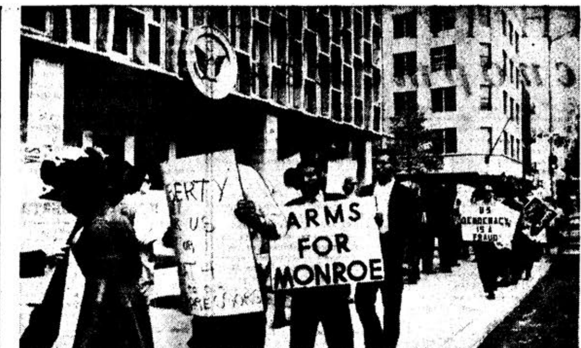
Соединенные Штаты Америки. В Нью-Йорке у здания делегации США в Организации Объединенных Наций состоялась демонстрация против расистских бесчинств в южных штатах. Демонстранты несли плакаты, осуждающие ку-клукскланские зверства. НА СНИМКЕ: группа демонстрантов с плакатами «Свобода для нас или смерть нашим угнетателям», «Демократия в Соединенных Штатах — обман».