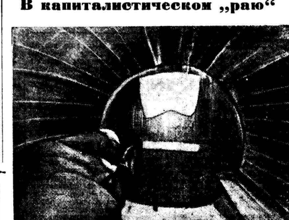
Данно буржуазная печать расписывает, называя ее «государством всеобщего благосостояния»... (Caption for the globe illustration)

Данно буржуазная печать расписывает, называя ее «государством всеобщего благосостояния»... (Text about the 'paradise' of capitalism)