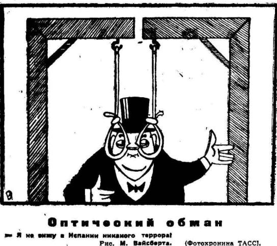
«Я не вижу в Испании никакого террора»... (Caption for the optical illusion illustration)

менее задал: «Неразумно и опасно принимать спешные решения по этому вопросу»... (Text about the UN discussion on nuclear weapons)