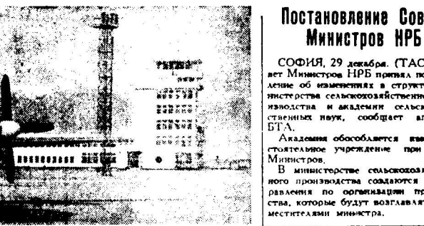
Афганистан. В Кабуле с помощью Советского Союза построен международный аэропорт. На снимке: советский лайнер «Ил-18» на Кабульском аэродроме.