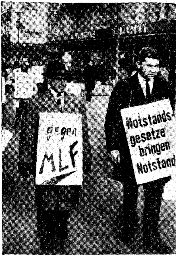
ФРГ. По улицам Эссена идут демонстранты. В их руках профсоюзные антифашистские плакаты, домохозяйки и студенты. Они протестуют против намерения властей ввести в стране чрезвычайное законодательство и требуют отозвать Западную Германию от участия в «двухсторонних» ядерных силах НАТО.