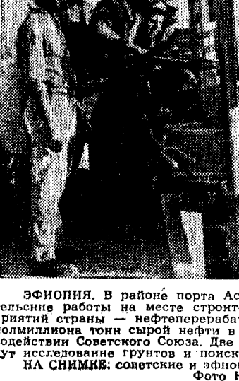
Эфиопия. В районе порта Асаб на Красном море ведутся изыскательские работы на месте строительства одного из крупнейших предприятий страны — нефтеперерабатывающего завода производительностью миллион тонн сырой нефти в год. Предприятие будет сооружено при содействии Советского Союза. Две группы советских специалистов уже ведут исследование грунтов и поиски воды в районе предстоящей стройки. НА СНИМКЕ: советские и эфиопские специалисты у буровой установки.

НЬЮ-ЙОРК, 10 января. (ТАСС). Закончилась неудачей попытка запустить сегодня ракету «Титан-1» с мыса Канаверал, сообщает агентство ЮПИ. Военно-воздушные силы США планировали запустить эту новейшую американскую ракету на расстоянии около 10 000 километров.