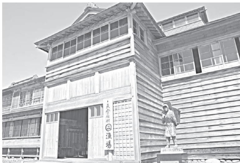
Старинный рыболовный стан.

На въезде в Румои мы посетили местечко Обира. Здесь расположены два старинных рыболовных стана с башней, их построили в 1905 году и ка-