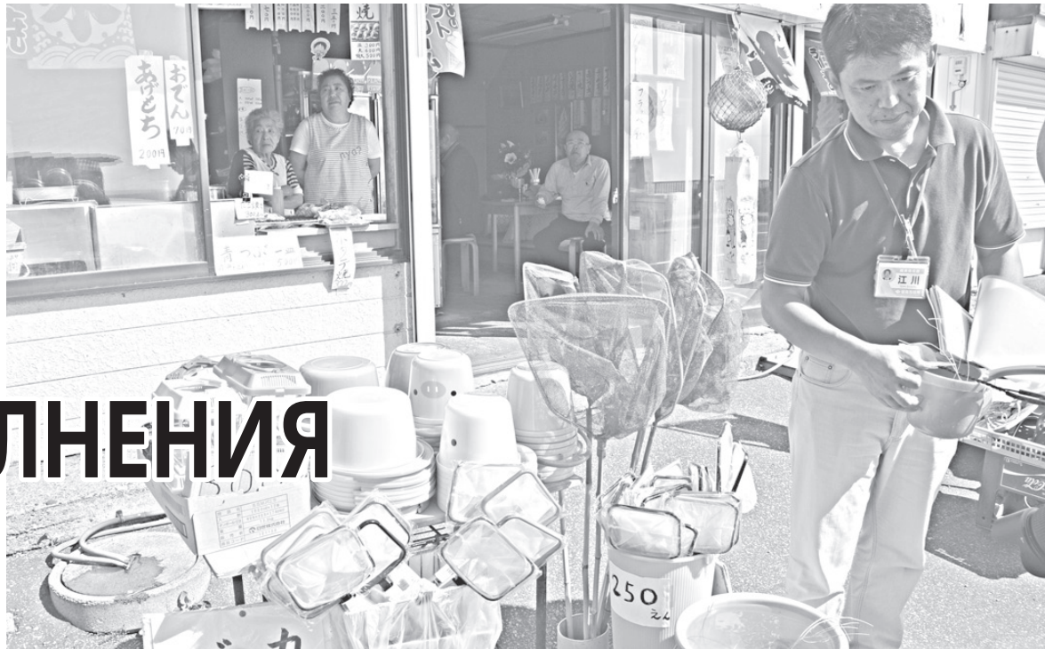
Снасти для ловли краба исогани.

Все прибрежные дороги Хоккайдо заасфальтированы, на машине можно абсолютно спокойно проехать весь остров по периметру. И даже к сельскохозяйственным районам ведут скоростные трассы — хайвеи. На протяжении всего пути по Хоккайдо прямо над дорогой через каждые несколько метров можно заметить свечящиеся красные и желтые стрелки. Это местная фишка — зимой на Хоккайдо дороги переметает настолько, что лишь эти стрелки позволяют водителю безошибочно определить границы проезжей части.