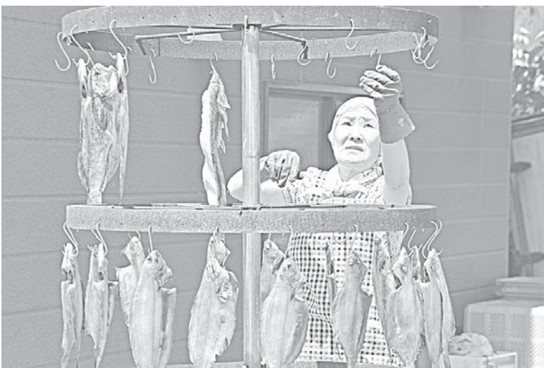
Хозяйка кафе вялит рыбу на солнце, посетители могут следить за процессом.

вый рынок, где торгуют непосредственно сами рыбаки. А рецепты местного меню разрабатывают прямо здесь, на месте, собственными силами. В среднем в таких придорожных кафешках останавливаются 200 — 300 человек в месяц.