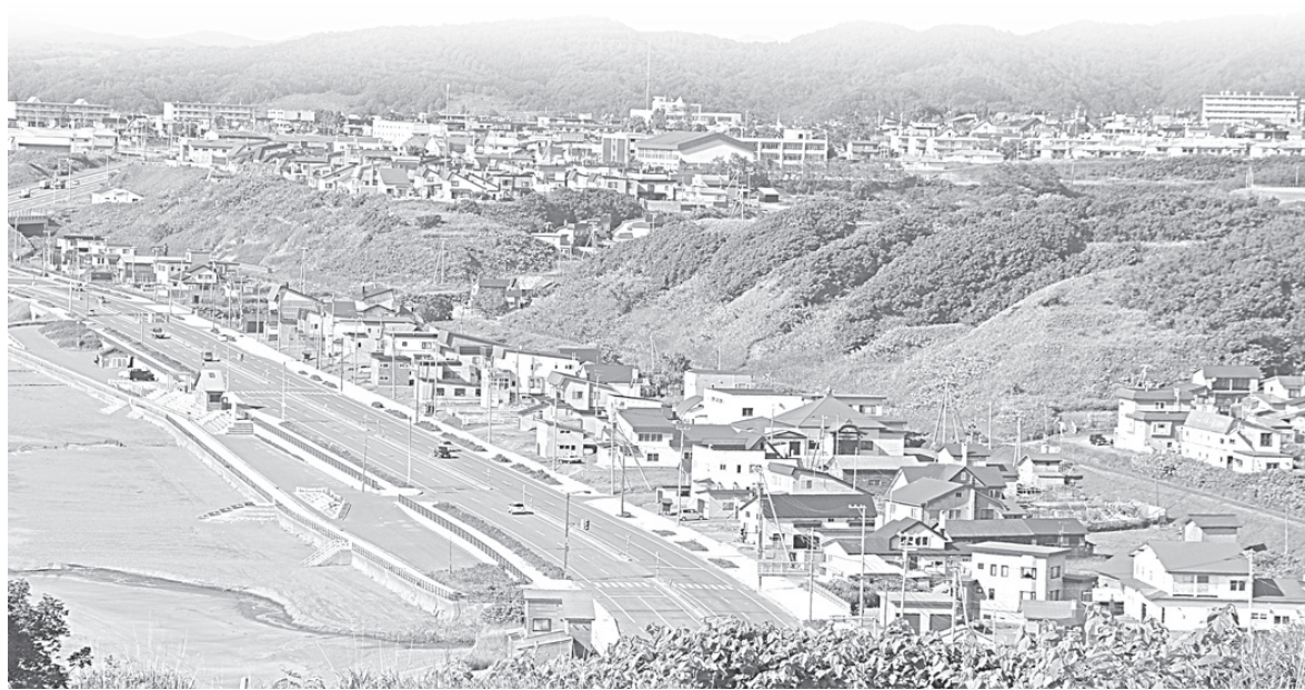
Вид на Румои.