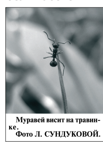
Муравей висит на травинке.

Занимательным этим явлением, сотрудники заповедника попытались выяснить природу странного поведения муравьев. Оказалось, что это явление широко распространено и давно привлекало внимание ученых. Наблюдения за муравьями показали, что забираться на кончики травянок, вцепляться в них жвалами и неподвижно висеть в таком положении долгое время насекомых заставляет поселившийся в их организме