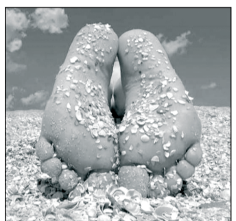
Испания, Греция и Таиланд.

Россияне в 2013 году совершили около 32 млн. поездок за рубеж. Таким образом, Россия вышла на третье место в списке европейских стран, граждане которых осуществляют наибольшее количество заграничных путешествий.