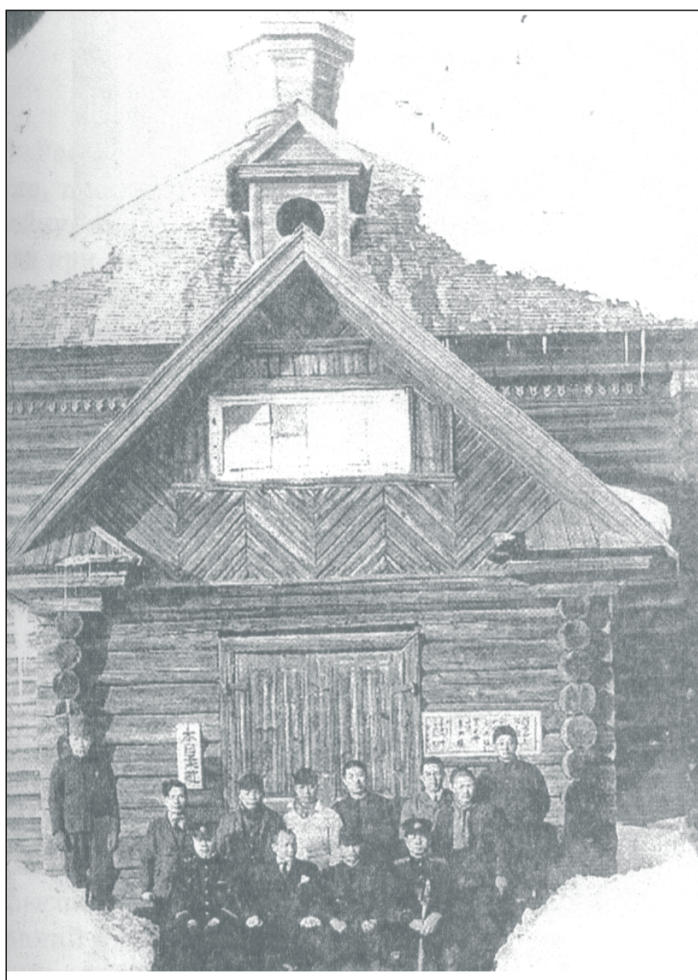
Народный дом (бывшая русская церковь). Наяси. Карафуте.

этот шум голос старосты: «Тише, не напирай, всем хватит! Не хватят — батюшка еще насветит!»