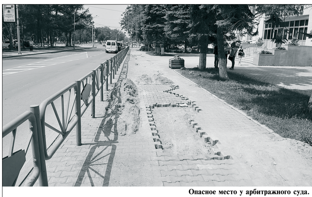
Опасное место у арбитражного суда.

...Заканчивается лето. Погода на Сахалине пока еще благоприятствует проведению ремонтных работ на тротуарах. Сейчас бы и развернуться, пока не наступил сезон дождей. Увы, приходится констатировать, что активности на этом фронте не наблюдается. Судя по информации, почерпнутой из интернет-ресурса http://findtenders.ru/tenders/tendery-kommercheskih-kompanij/37013-administratsiya-gorodajuno-sahalinska , до середины августа тендеров на ремонт тротуаров нет, увы, за исключением ремонта по ул. Горького, где пешеходов значительно меньше, чем в центре города. Наблюдательные горожане