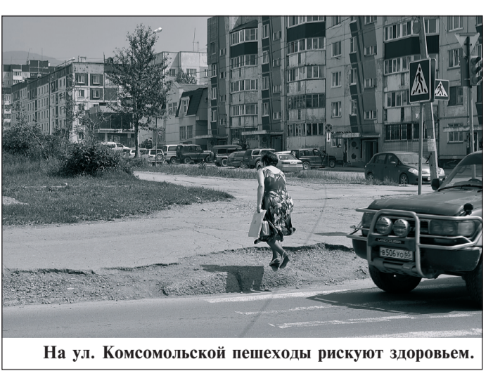
На ул. Комсомольской пешеходы рискуют здоровьем.