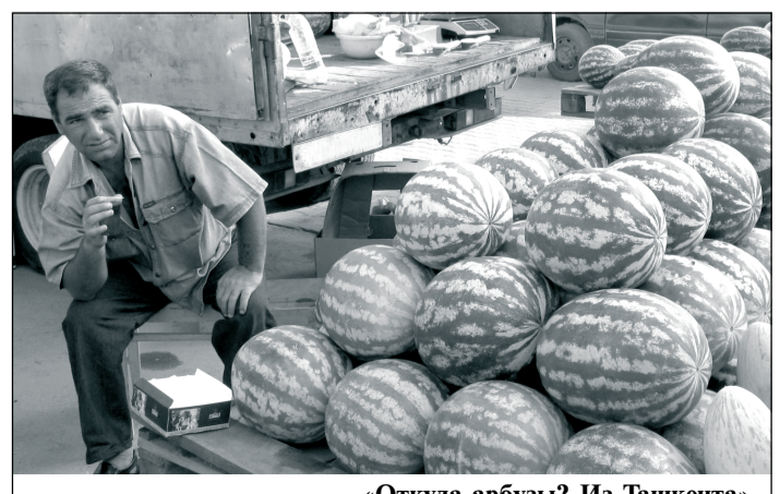
«Откуда арбузы? Из Ташкента».