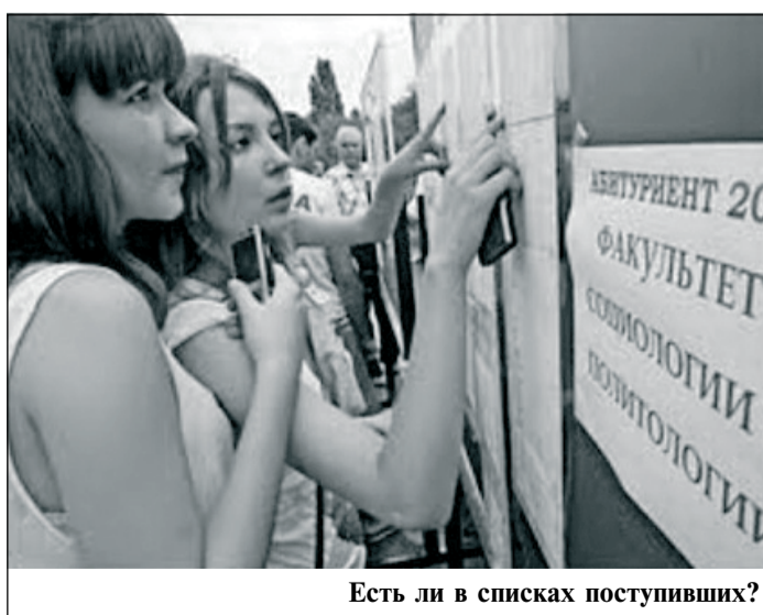
Есть ли в списках поступивших?

ложенных на территории Москвы и Московской области, вызвало особую волну беспокойства у абитуриентов. Это было связано с тем, что названия данных образовательных организаций (Московская высшая школа экономики – финансовый институт, Институт моды, дизайна и технологий, Институт практического востоковедения, Институт управления, экономики, права и искусства и Новый гуманитарный институт) очень похожи на крупнейшие российские учебные заведения. В итоге, не разобравшись в ситуации, десятки людей осаждали известные вузы, пытаясь забрать свои заявления. В общей сложности в июле Рособрнадзор запретил продолжать приемную кампанию 17 организаций. «Запрет на прием – это лишь один из способов воздействия на нерадивые высшие учебные заведения, причем эта норма новая и раньше не использовалась, –