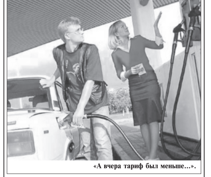
«А вчера тариф был меньше...».