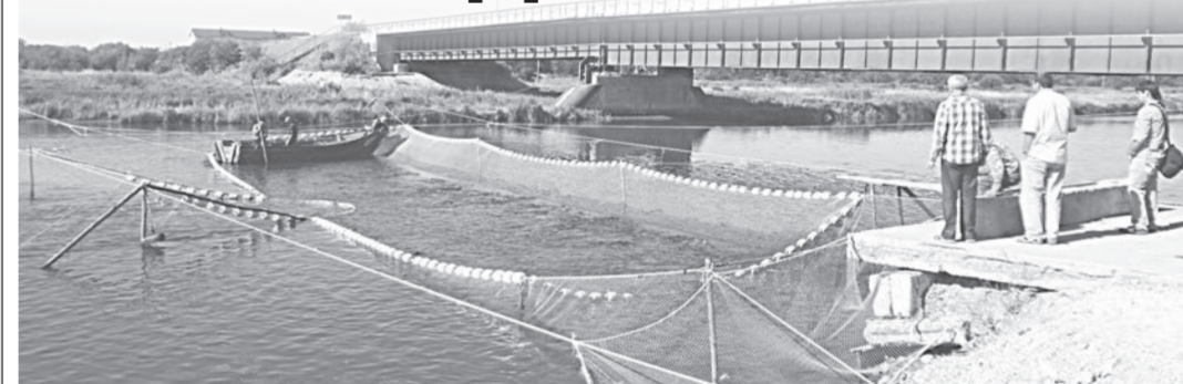
Так выглядит РУЗ на реке Таранай.

Но, как бы по-разному не выглядели рыбоучетные заграждения, функции они выполняют всегда одни и те же — помогают учитывать рыбу и регулировать ее проход на нерестилища.