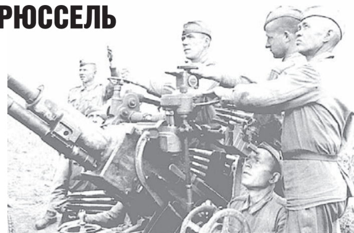
Зенитчики. 1944 год.

• 3 сентября 1944 года войска 2-го и 3-го Украинских фронтов завершили ликвидацию окруженной группировки немецко-фашистских войск юго-западнее Кишинева и на западном берегу реки Прут. Войска союзников вступили в столицу Бельгии — г. Брюссель, освобожденный бельгийскими патриотами. Президиум Верховного Совета СССР принял Указ о награждении орденами и медалями работников строительства завода № 410 Народного Комиссариата нефтяной промышленности СССР за успешное окончание строительства завода по выпуску оборонной продукции. Опубликовано сообщение Чрезвычайной государственной комиссии о разрушении