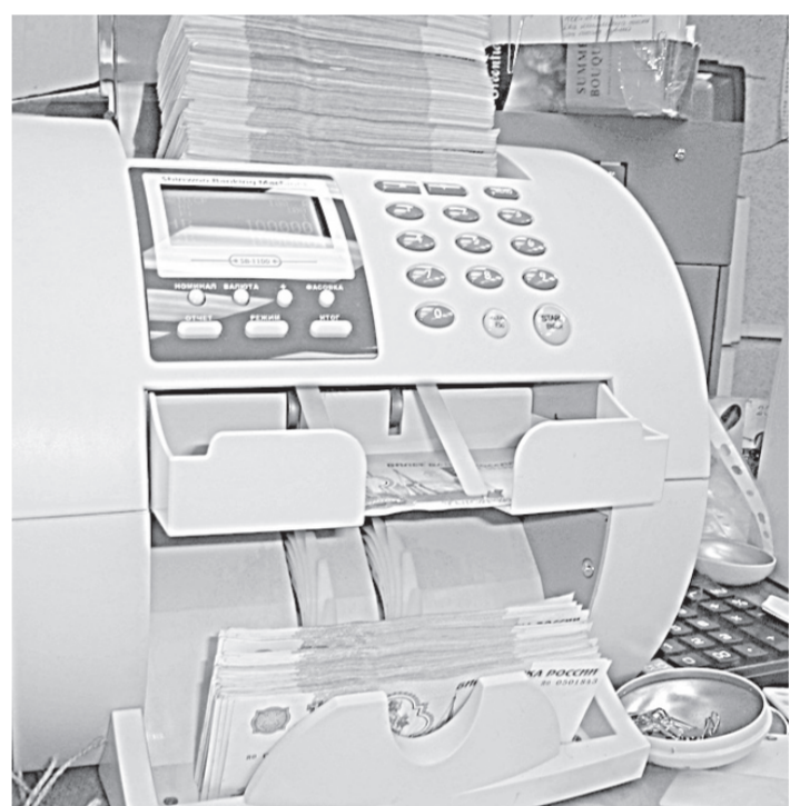
В кредитных организациях используют специальное оборудование, для того чтобы определить подлинность банкнот. По стандартам работники обязаны проверить не менее четырех способов защиты денежного знака.

ла студентам принять в этом активное участие.