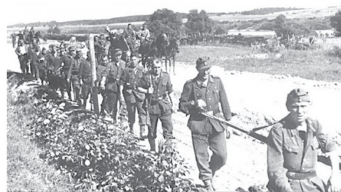
Немцы отступают. 1944 год.

• 9 сентября 1944 года в Болгарии началось всенародное восстание под руководством Рабочей партии страны. Реакционное правительство Болгарии было свергнуто и образовано новое правительство Отечественного фронта, которое объявило войну фашистской Германии и обратилось к Советскому правлению с просьбой о перемирии.