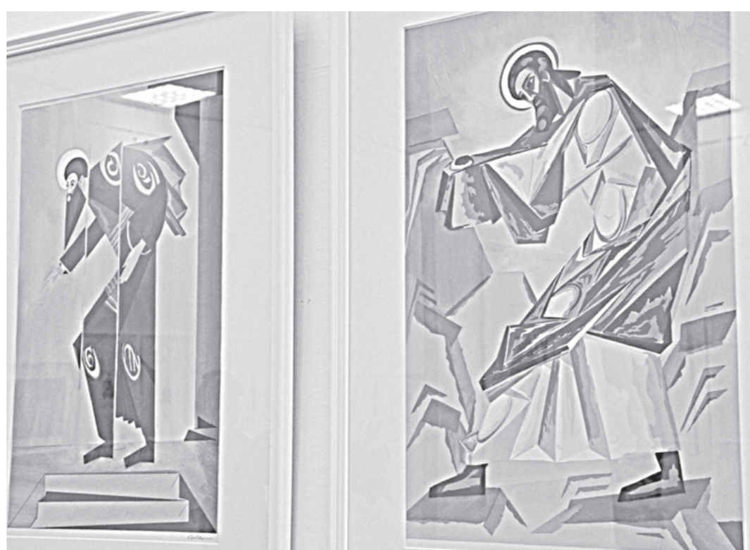
Больше всего места кураторы выставки отвели эскизам Натальи Гончаровой.

Один зал музея книги Чехова кураторы выставки отделили представителям более традиционного направления, другой — во власть русского авангарда. От созвездия представленных имен можно получить настоящий культурный шок. Михаил Врубель, Александр Бенуа, Борис Кустодиев, Константин Коровин, Валентин Серов, Мстислав Добужинский — это только часть авторов, по праву составляющих славу и гордость русского изобразительного искусства. Но на выставке они представлены в несколько иной ипостаси,