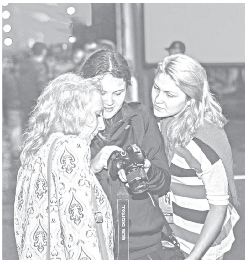
Первое фото с берега Тунайчи — в личный архив или в социальные сети.

время его юности существовали другие региональные форумы. Он, например, в свое время был активным участником студенческих строительных отрядов, ставших богатейшей молодежной традицией своего времени.