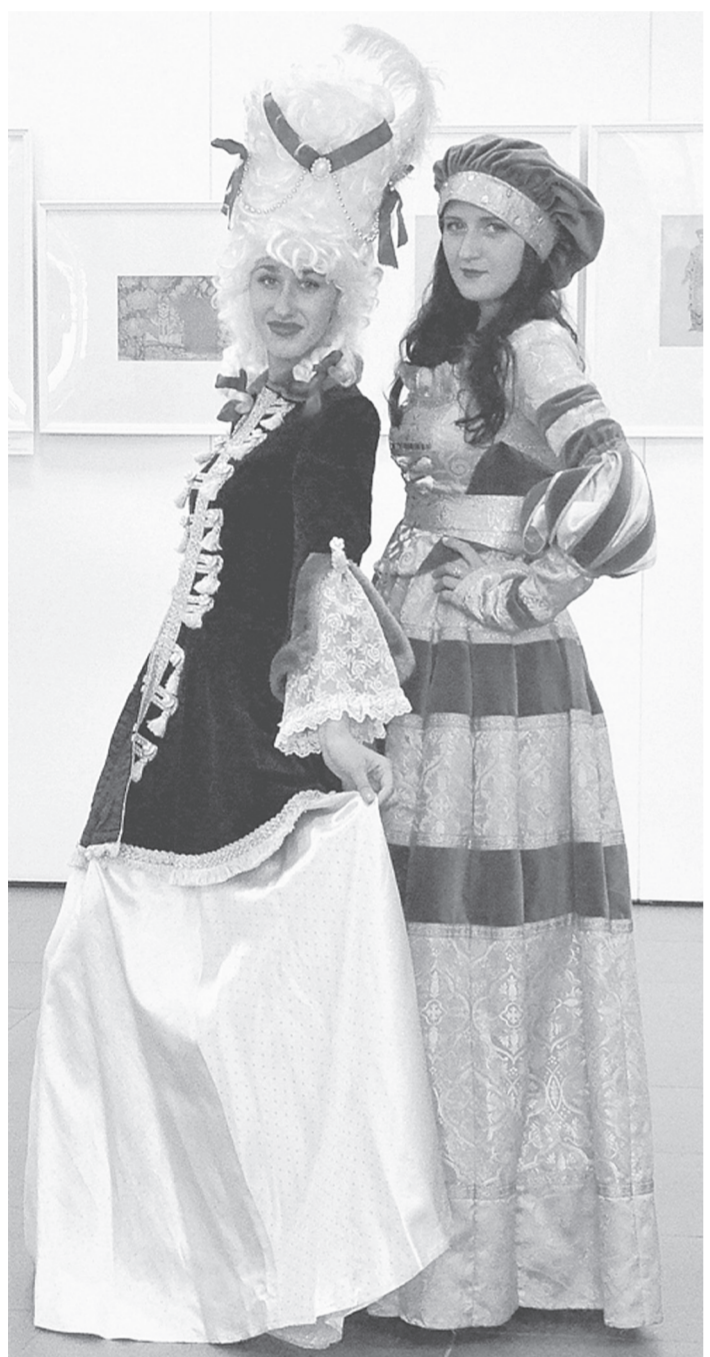
Атмосферу выставки идеально дополнили студенты Сахалинского колледжа искусства в костюмах собственного изготовления.

коллекциями с провинциальными. А инициатором замечательного проекта стал