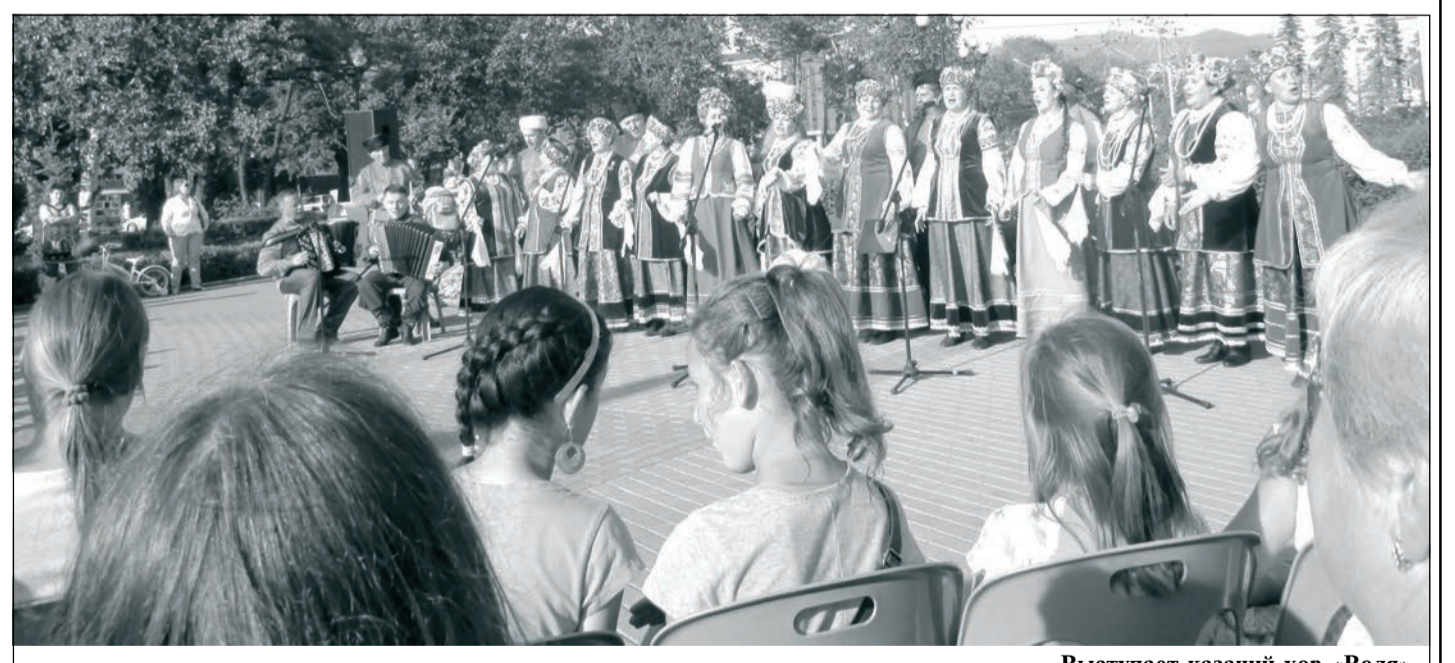
Выступает казачий хор «Воля».