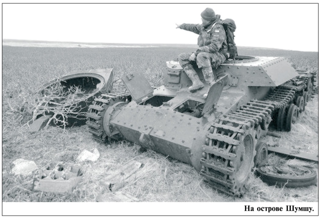
На острове Шумшу.

Минобороны РФ в сентябре проведет экспедицию на остров Шумшу (Курилы), где в годы второй мировой войны базировалась крупная группировка японских войск. Об этом сообщил 2 сентября журналистам замглавы ведомства генерал армии Д. Булгаков. «Проведение экспедиции запланировано в период с 6 по 25 сентября с привлечением сил и средств военного ведомства», — сказал Булгаков. Генерал уточнил, что в мероприятии задействуют управление по увековечению памяти погибших при защите Отечества, «Поисковое движение России», Русское географическое общество и министерство культуры. «Всего около 50 человек», — пояснил замминистра обороны. По его словам, экспедиция займется поиском захороненных останков воинов, военной техники, которую затем восстановят и передадут музеям, а также будет ухаживать за воинскими захоронениями на острове. Генерал также уточнил, что участники экспедиции отправятся на Шумшу на судне Тихоокеанского флота с Камчатки, куда они попадут самолетом из Москвы. На остров планируется организовать и пресс-тур, в ходе которого будет снят документальный фильм о заключительных сражениях советской армии на Дальнем Востоке в 1945 году.