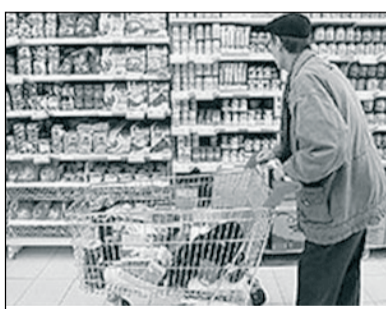
Удивительное — рядом.

Цены на бензин за август выросли на 2 проц., на дизельное топливо — на 1,4 проц.