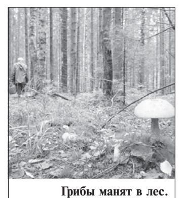
Грибы манят в лес.