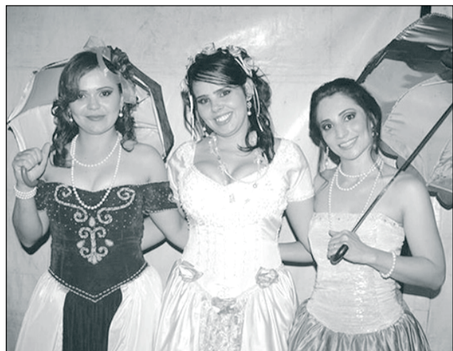
Мужчины им нужны — для романтики, брака и продолжения рода.

ЖЕНСКАЯ СИЛА Мест, подобных Ноива ду Кордейру, то есть чисто женских поселений, на Земле нет. Ну, а те точки планеты,