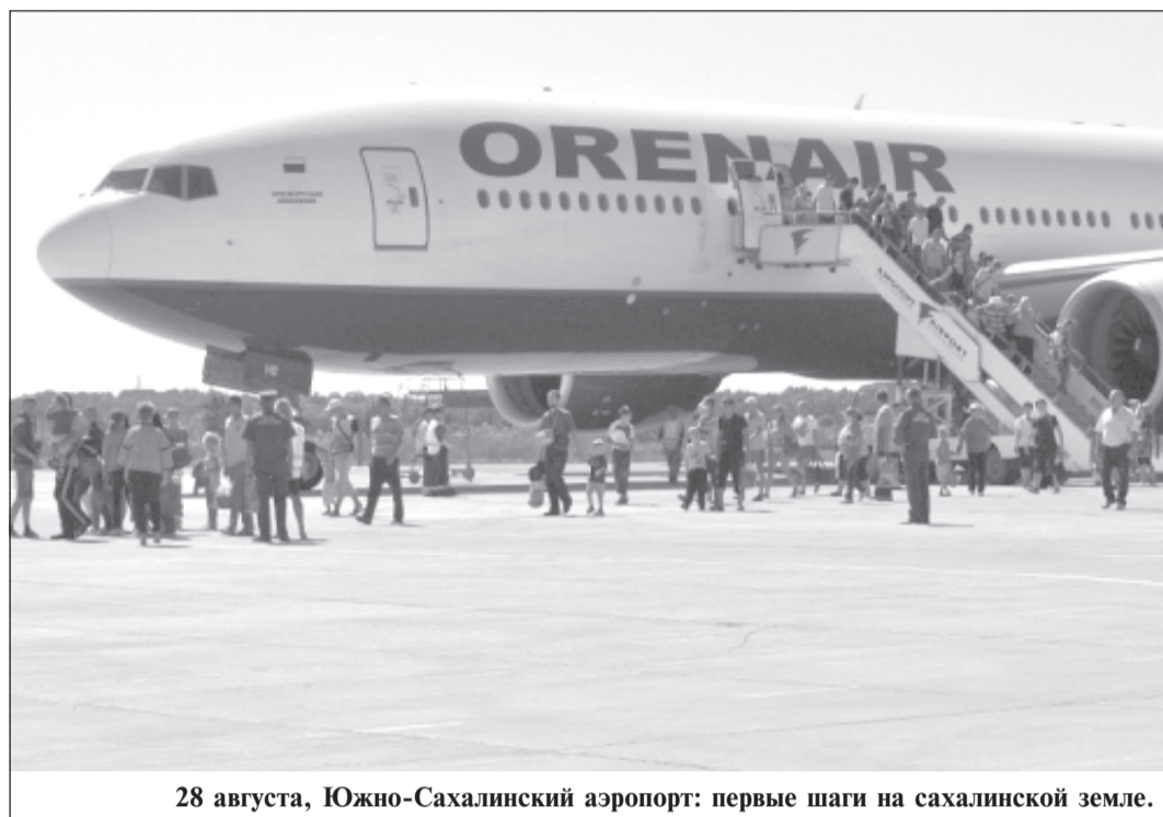
28 августа, Южно-Сахалинский аэропорт: первые шаги на сахалинской земле.

Чтобы хотя бы частично получить ответ на этот вопрос, нужно побывать в пунктах временного содержания беженцев и посмотреть этим людям в глаза. Поэтому летним днем я отправилась в реабилитационный центр «Аралия», расположенный в Южно-Сахалинске.