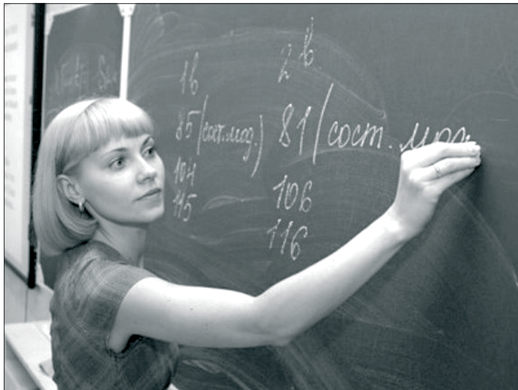
В школах по-прежнему не хватает молодых учителей.

Итак, по информации главы правительства, затраты на образование — самая существенная статья расходов областного бюджета. В 2014-м они превысят 16 млрд рублей. Созданы практически все условия для достижения новых результатов — в рамках областной государственной программы развития образования на 2014 — 2020 годы сформированы нормативно-правовая, законодательная, материально-техническая и финансовая базы. Действует система социальной поддержки педагогических кадров, усовершенствована подготовка и повышение квалификации кадров, но... ожидаемый эффект не достигнут. Закономерен вопрос: почему при столь масштабных усилиях реформирования и столь существенном росте финансирования качество образования оставляет желать лучшего? По разным параметрам оно отстает от среднего по России. И это при том, что обновили оборудование зданий, обеспечили учителей услугами интернета. Кроме того, ежегодно из областного бюджета тратится 40 — 50 млн рублей на увеличение его скорости.