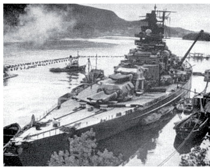
Линкор (линейный корабль) «Тирпиц». В Германском флоте с 1939 по 1944 год.

• 12 ноября 1944 года войска 2-го Украинского фронта с боями заняли более 30 населенных пунктов в Венгрии. Северо-западнее города Цеглед наши войска в результате упорных боев овладели городом Монор, что в 25 км от Будапешта. В Восточной Пруссии наши подразделения на ряде участков вели разведку боем. В одном районе советские бойцы ворвались в расположение противника и разгромили группу немцев. Захвачены в плен солдаты танковой дивизии СС «Герман Геринг» и других соединений. За день уничтожено свыше 200 немецких солдат и офицеров.