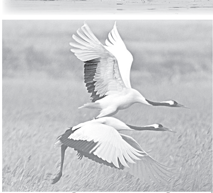
Японские журавли на озере Весловском.

(они полиняли и их легко перепутать с черношейными поганками). В устье полуострова Весловский отмечены серая цапля и два японских журавля. Останавливаются на Кунашире и хищники. Сейчас можно наблюдать пустельгу, сапсана, белоплечего орлана. Последние держатся на острове всю зиму. Сейчас основное место их обитания — озеро Песчаное. Зимуют на Южных Курильских островах и другие мигранты: большой крохаль, американская синьга, красношейная поганка, чернозобая, чернозобая и белошейная гагара, тонкоклевая и толстоклювая кайры, морянка, очковый чистик, морская черныш, орлан-белохвост, зимняк, кочующие воробьиные (синицы, поползни, снетиры, клесты и др.). Как пояснил М. Анти-