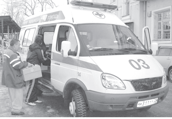
Сельской медицине нужна скорая помощь.

(По материалам информагентств и печати).