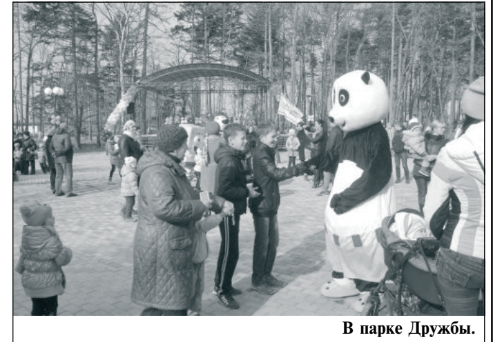
В парке Дружбы.

Парк создан на месте бывшей лесопыльной станции, где территорию 4,4 гектара занимал дендрарий, сообщается на сайте администрации города. Два года назад начались работы по преобразованию заброшенного земельного участка. И теперь это благоустроенная, реконструированная зона, чудесный уголок для прогулок, отдыха, занятий спортом, торжественных мероприятий.