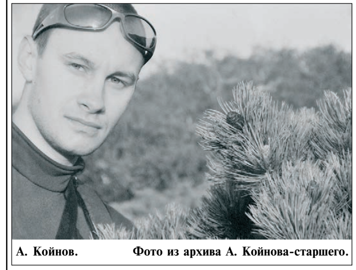
А. Койнов.