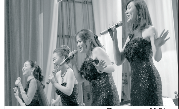
Поет квартет «M-Diva».