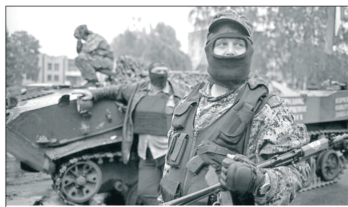
Для одних — защитники своей земли, для других — сепаратисты.

Конфликт в Украине влияет и на повседневную жизнь украинцев, говорит социолог: «Вопросы, касающиеся и благополучия людей, и состояния экономики, и перспектив, как пережить войну, связаны с конфликтом — так что потенциал социального протеста катализирован вокруг формирования образа