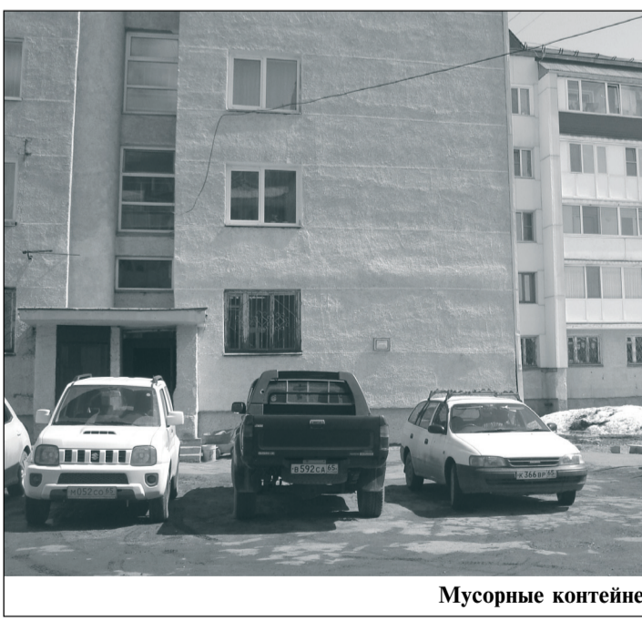
Мусорные контейнеры не самые приятные соседи.

Никому бы не понравилось, если бы почти перед входом в подъезд установили контейнерную площадку с четырьмя емкостями, куда сносился бы мусор от шести многоквартирных домов, продуктового магазина и медучреждения. Вот и жильцы второго подъезда дома № 13а по Спортивному проезду г. Южно-Сахалинска, где наблюдается как раз такая ситуация, стали писать во власть и возмущаться нарушением их прав на благоприятную среду обитания.