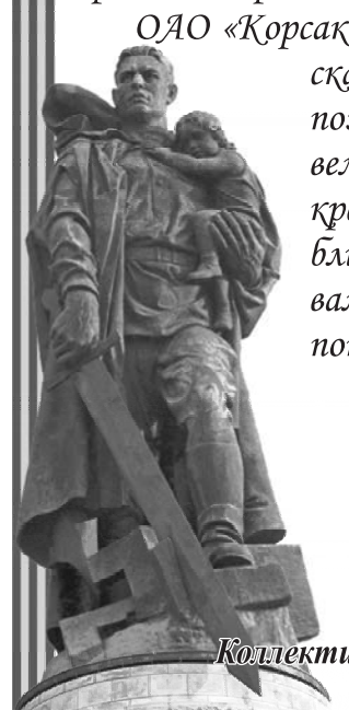
Коллективы ОАО «Корсаковский морской торговый порт», ООО «Морская тальманская служба».

ОАО «Корсаковский морской торговый порт» и ООО «Морская тальманская служба» искренне, от всей души поздравляют вас, дорогие наши ветераны, с этим великим праздником — Днем Победы, желают вам крепкого здоровья, благополучия вам и вашим близким и долгих счастливых лет жизни. Спасибо вам за мир, в котором мы все сейчас живем, низкий поклон вам, дорогие наши Герои!