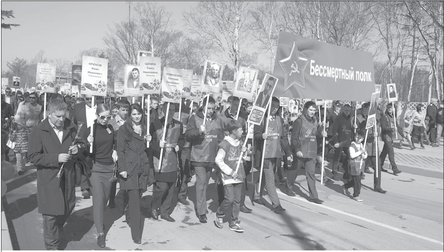
г. Южно-Сахалинск. С энтузиазмом встают люди в ряды «Бессмертного полка».