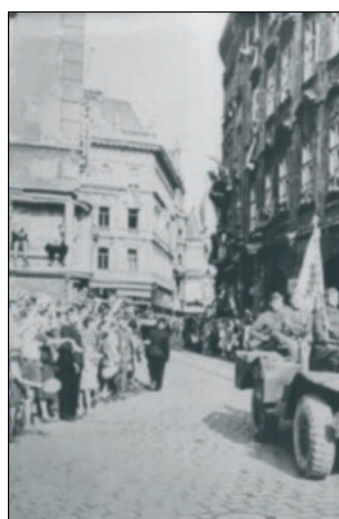
В небо городов Европы вернулось мирное солнце.

валины собора Святого Стефана в Вене, мост через Влтаву в Праге... На обороте этюдов автор записывал торопливые впечатления от встреч с местным населением — как со слезами радости советского солдата встречали чехи и австрийцы, предлагали чашку кофе. «Стоит большой праздник. Песни, шутки, братские объятия. А патри-