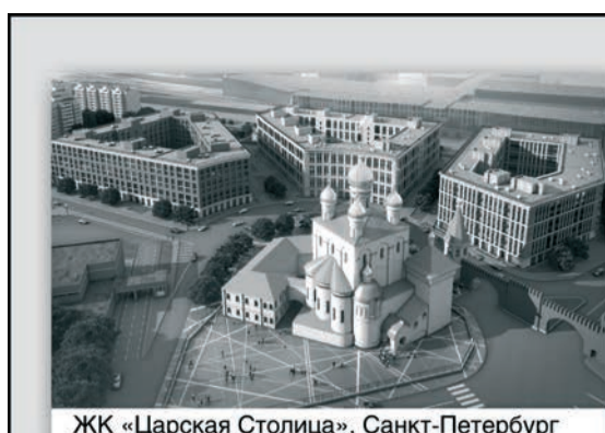
ЖК «Царская Столица», Санкт-Петербург