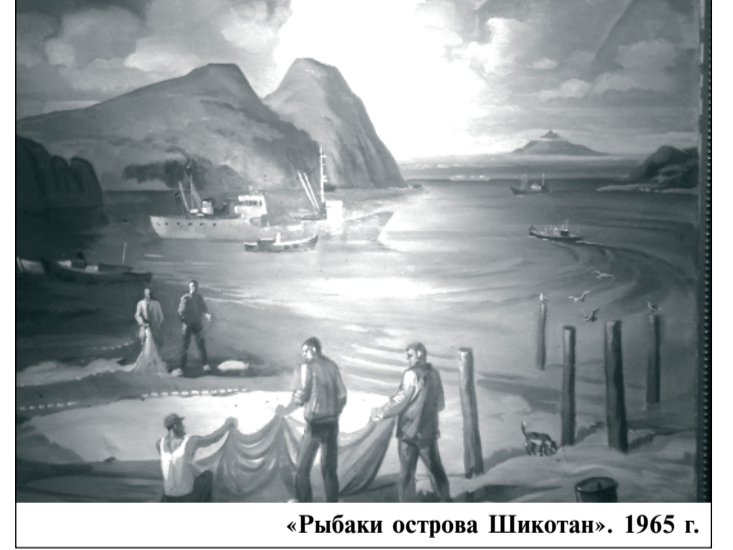
«Рыбаки острова Шикотан». 1965 г.