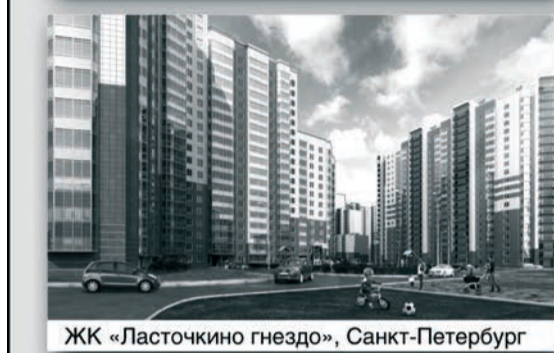
ЖК «Ласточкино гнездо», Санкт-Петербург