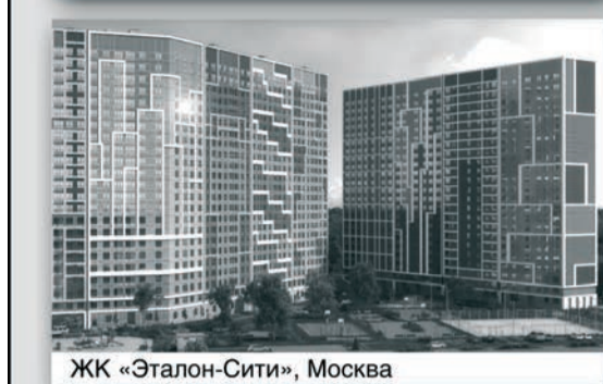
ЖК «Эталон-Сити», Москва