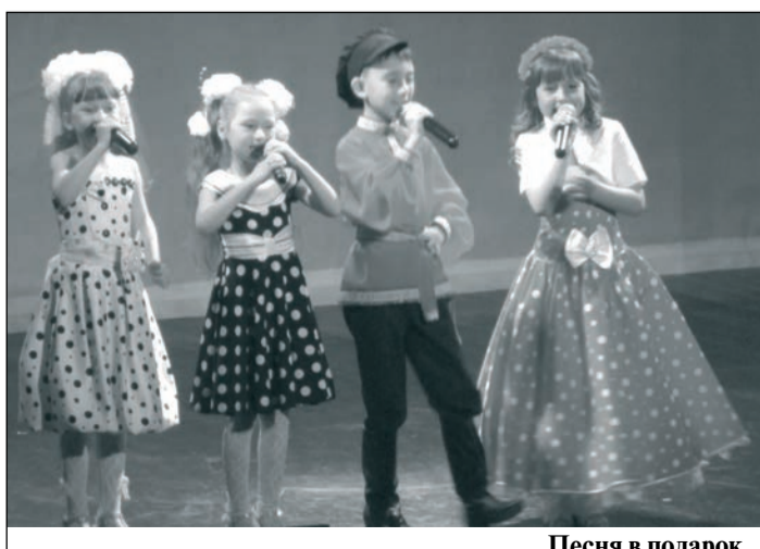
Песня в подарок.