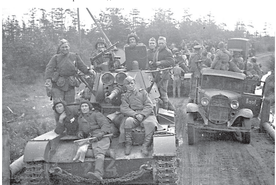
Колонна танков и грузовиков в сопровождении подразделений пехоты на марше

Наступление советских войск началось 11 августа в 7:45. Граница представляла собой в тех местах широкую просеку в тайге.