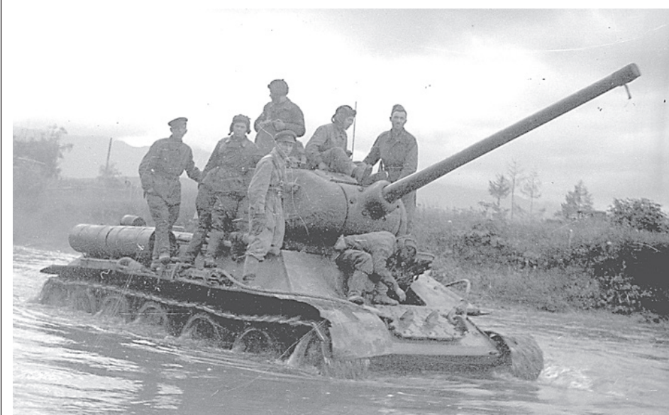
Танки Т-34 форсируют реку Хандаса-гава, вышедшую из берегов после ливня