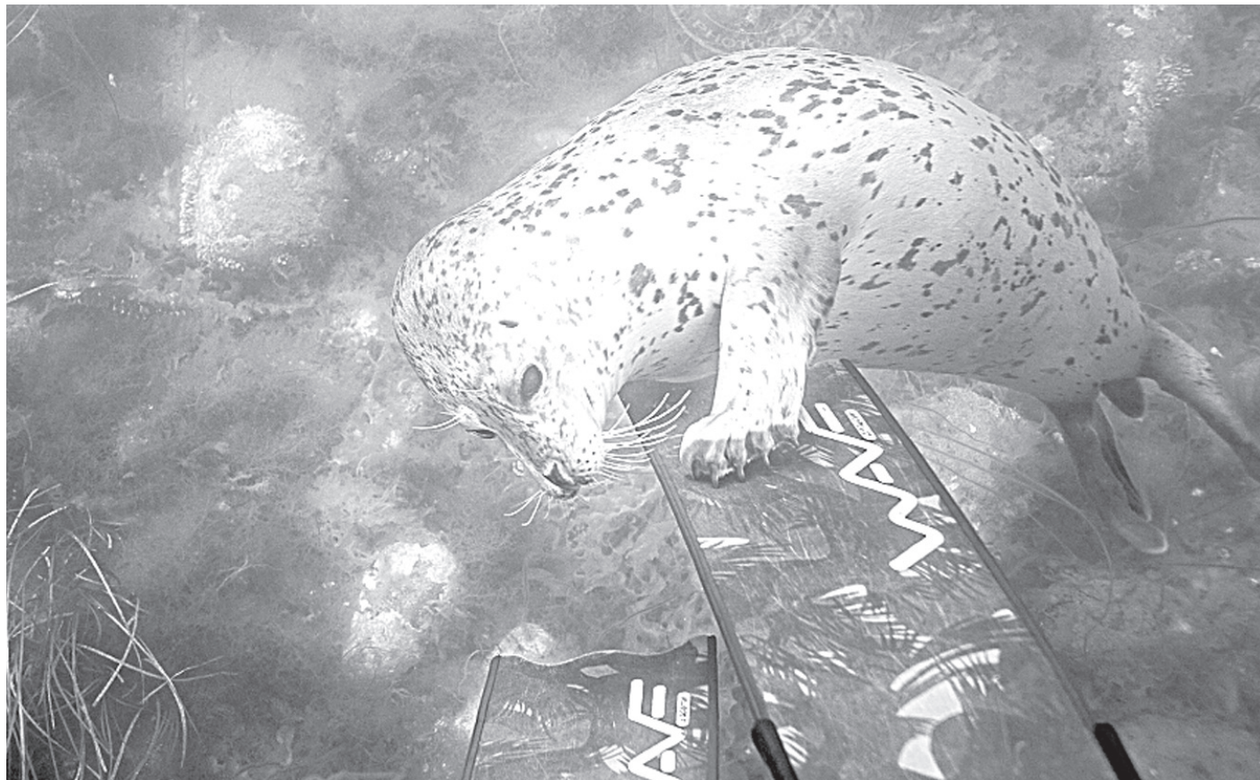
Более близкое знакомство начинается с ластов

Значительная часть времени была посвящена съемке подводных пейзажей. Безусловно удачей стали фото горбуши, начинающей подходить к кунаширским берегам. Но особенное удовольствие дайверы всегда получают во время общения с тюленями и другими крупными