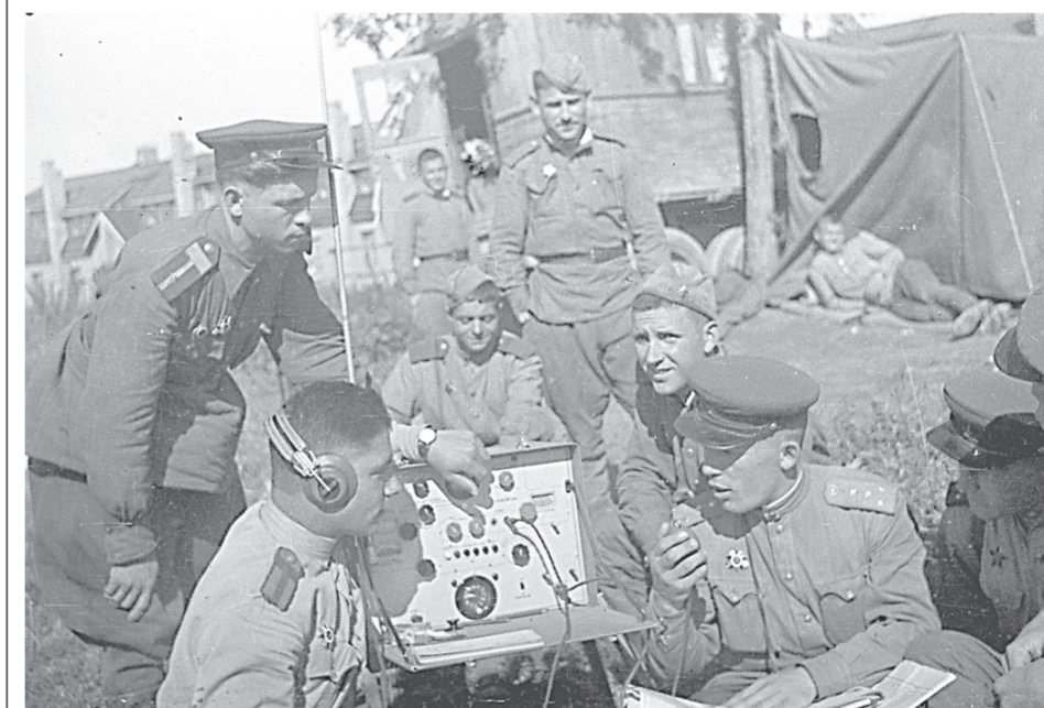
Группа красноармейцев и офицеров около полевой радиостанции