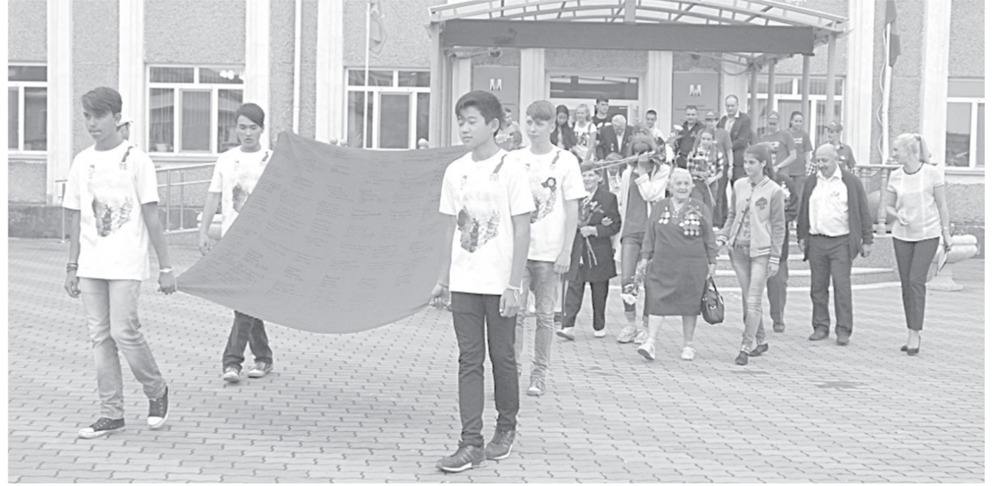
Шествие со знаменем в Углегорске

В каждом районе, где побывали организаторы акции «Знамя победителей», с горечью отмечали прискорбный факт: ветеранов Великой Отечественной с каждым годом становится все меньше. Но пока есть живая связь поколений — современной молодежи и тех, кто достойно пережил тяготы войны, — такие поездки обретают особый смысл.