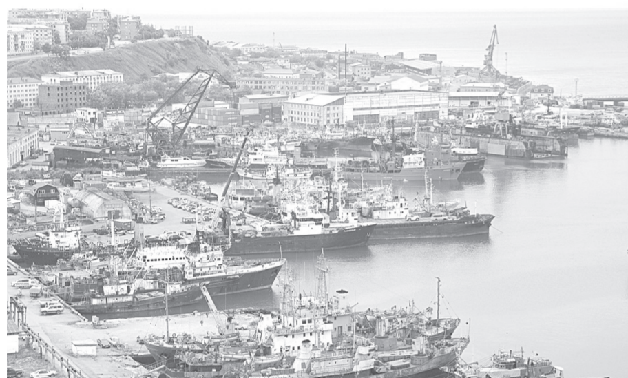
Корсаковский порт ждут глобальные перемены

Эти вопросы постепенно решаются: напомним, что первый хоспис в Корса-