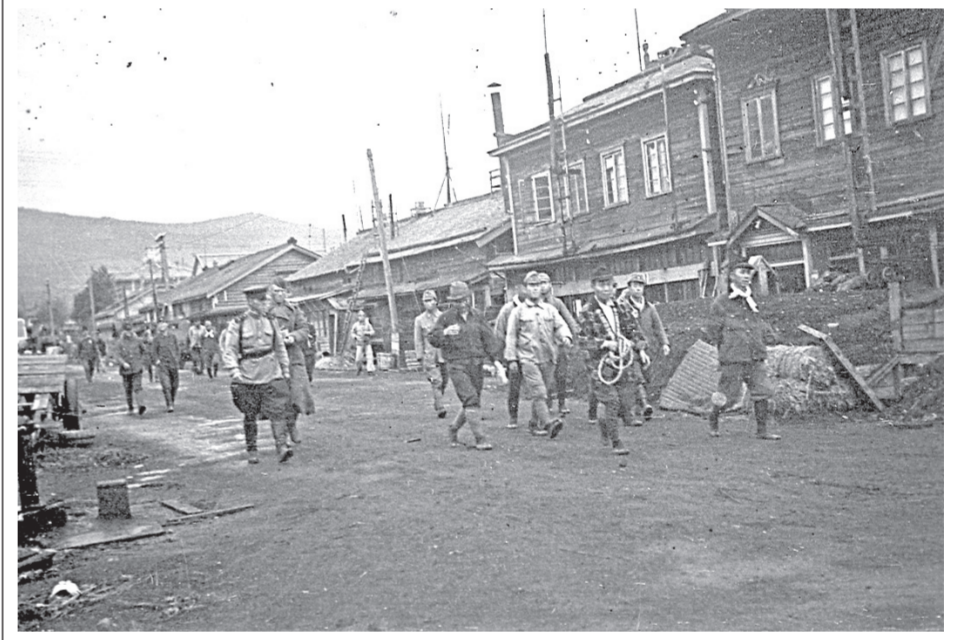
На улицах Тойохаары после освобождения города советскими войсками

сотрудник Государственного исторического архива Сахалинской области