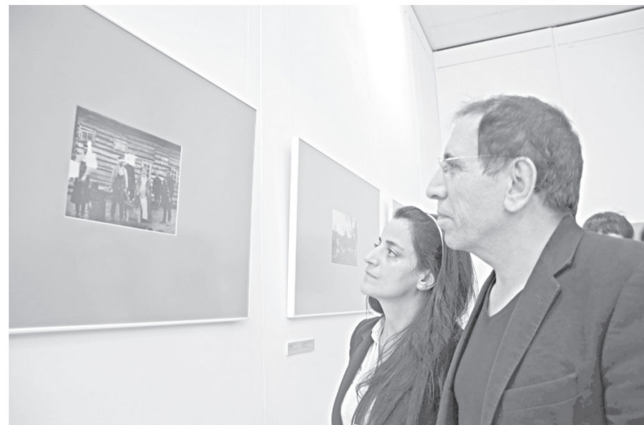
На выставку заглянул и председатель жюри фестиваля Моисей Махмальбаф с супругой

Прошлое острова представляют 22 уникальные фотографии из архива Российского литературного музея, сделанные во время путешествия А. Чехова на Сахалин. По замыслу автора, книга