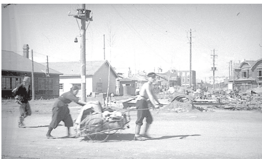
Японцы возвращаются в свои дома