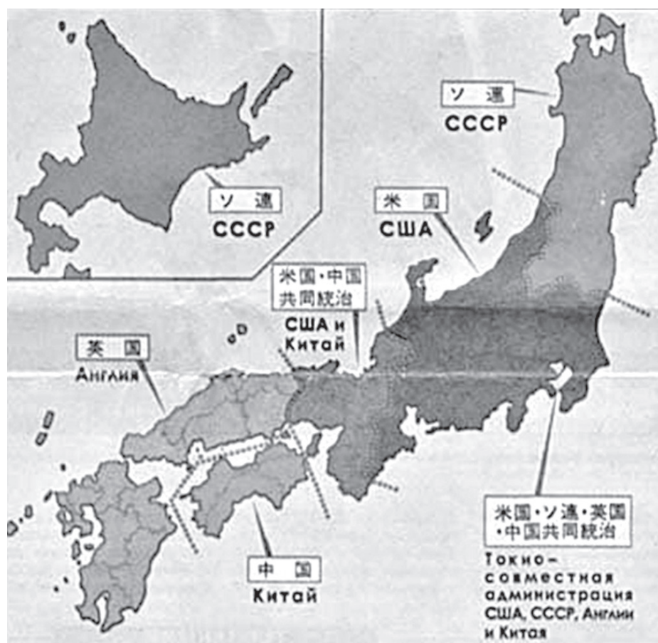
Предполагаемые зоны оккупации войсками союзников

В этот день была сделана попытка высадить советский десант на Хоккайдо.