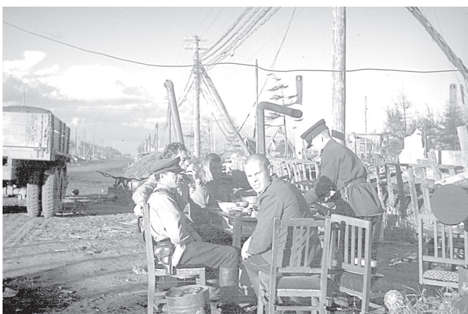
На Южном Сахалине начала налаживаться мирная жизнь