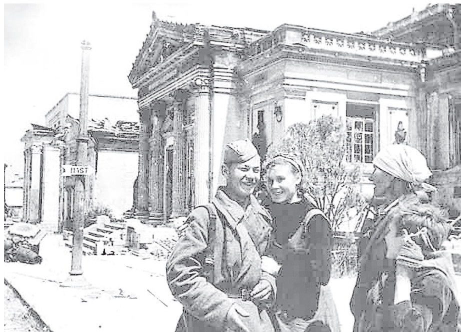
Фотохроника Великой Отечественной войны