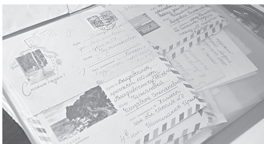
Многие экспонаты для чаплановского музея приносят сами жители села