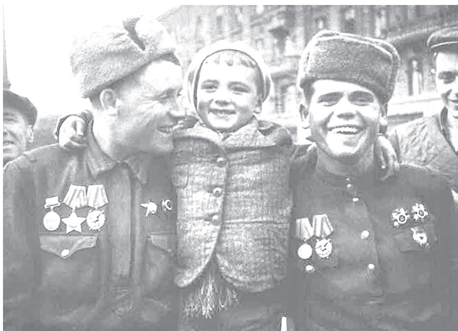
Советские солдаты в освобожденном городе

ко яркими благодаря тому, что авторы сохранили живой язык героев. Иногда даже кажется, что, читая, можно уловить интонации их голосов.