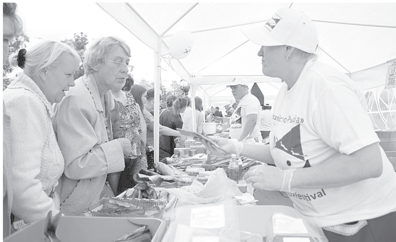
ФОТО ЛЮБКА ТОВШКИНОВА

Первый фестиваль «Остров-рыба» в Южно-Сахалинске стал хорошим продолжением Дня города