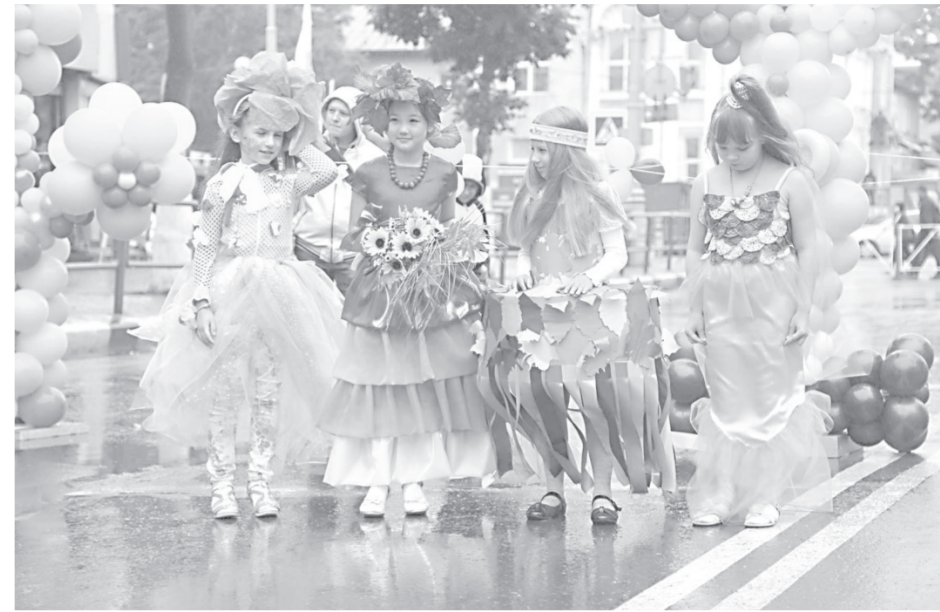
Костюм под названием «Подарок» продемонстрировала каждая из участниц дефиле

В рамках празднования Дня города на «Сахалинском Арбате» открыли фестиваль островных диаспор «Мир без границ». Мероприятие стало традиционным для региональной столицы. В этот раз татарский ансамбль «Дуслык» представил зрителям свои яркие танцевальные номера. А тайны Востока жителям и гостям города раскрыли участницы студии «Багира», исполнившие турецкий танец живота. Ансамбль «Русский терем» и Сахалинский народный хор порадовали южносахалинцев