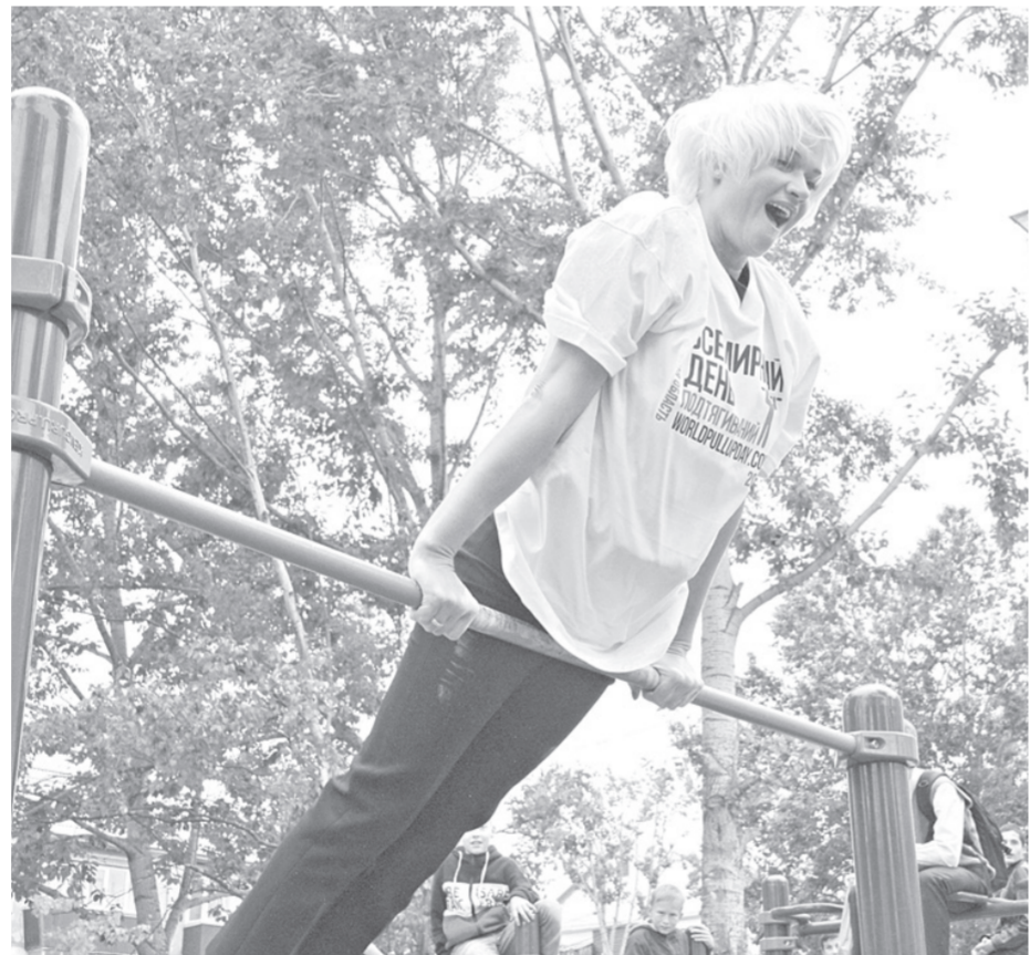
Для олимпийской чемпионки Светланы Хоркиной 15 подтягиваний – это не предел

ПОЕДИНКИ С ПЕРЕКЛАДИНОЙ Всемирный день подтягиваний в России стартовал с Южно-Сахалинска. 11 сентября 300 островных спортсменов от 4 до 53 лет бросили все силы на то, чтобы улучшить рекорд страны прошлого года. Южно-Сахалинск впервые принимал участие в подобном мероприятии. Его провел оргкомитет проекта «Спорт против подворотни». Помимо островной столицы, к спортивному празднику подключились еще около 500 городов мира. Результаты каждой страны суммируются, в итоге формируется неформальный рейтинг. В прошлом году Россия заняла в нем второе место из 55 стран. В сумме 1300 российских любителей спорта подтянулись более 21 тыс. раз. В этом году планы еще более амбициозные.