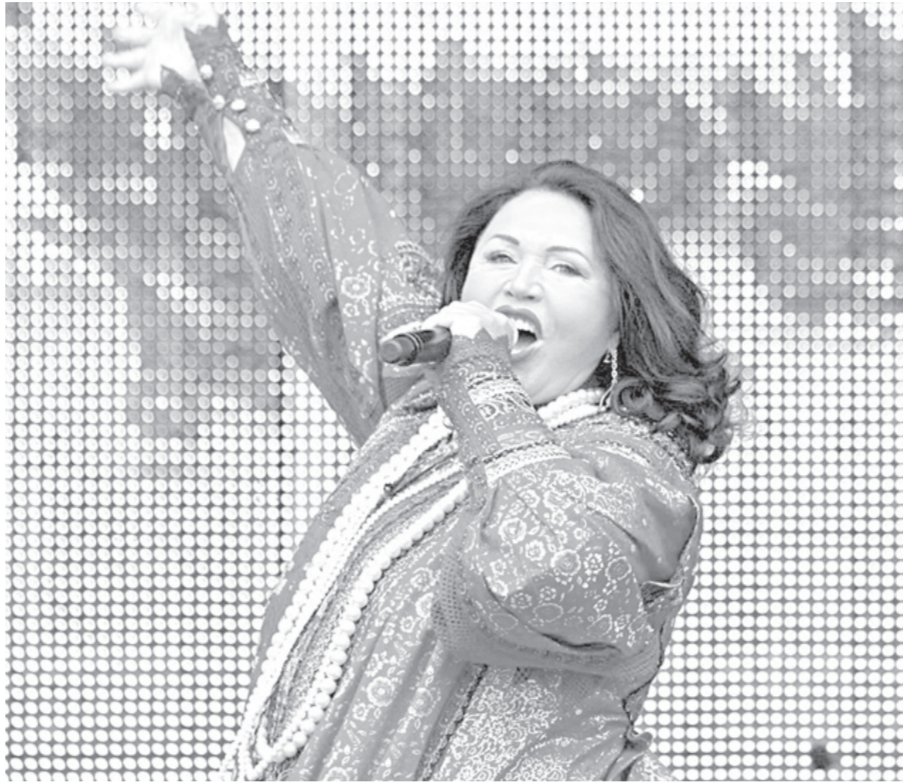
Различные вокальные техники, стили и жанры даются этой удивительной исполнительнице так легко, что каждое выступление Надежды Бабкиной и коллектива «Русская песня» – это событие, грандиозное по своим масштабам