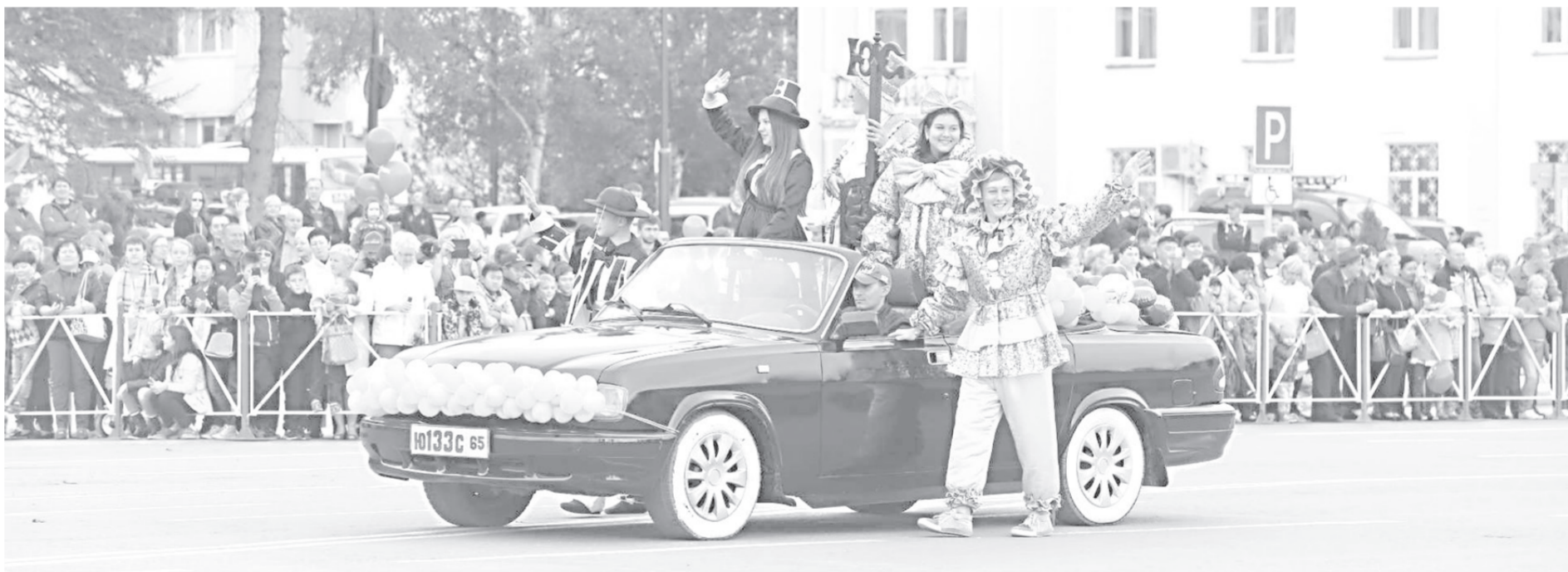
Ключ от города – в надежных руках

Продам а/м Daihatsu Terios, 2003 г., 4WD, сигнализация. Тел. 41-77-11.