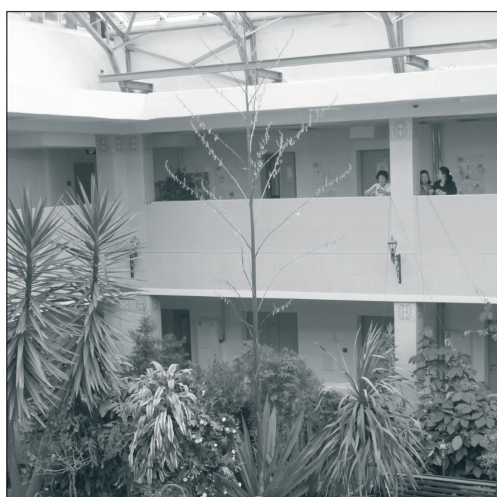
Агава и ее 10-метровое соцветие, достигшее стеклянной крыши.

Совсем недавно предметом особого восхищения здесь была крупноцветковая магнолия. Привезенный из Сочи лет пятнадцать назад саженец превратился в раскидистое дерево. Этим летом оно покры-