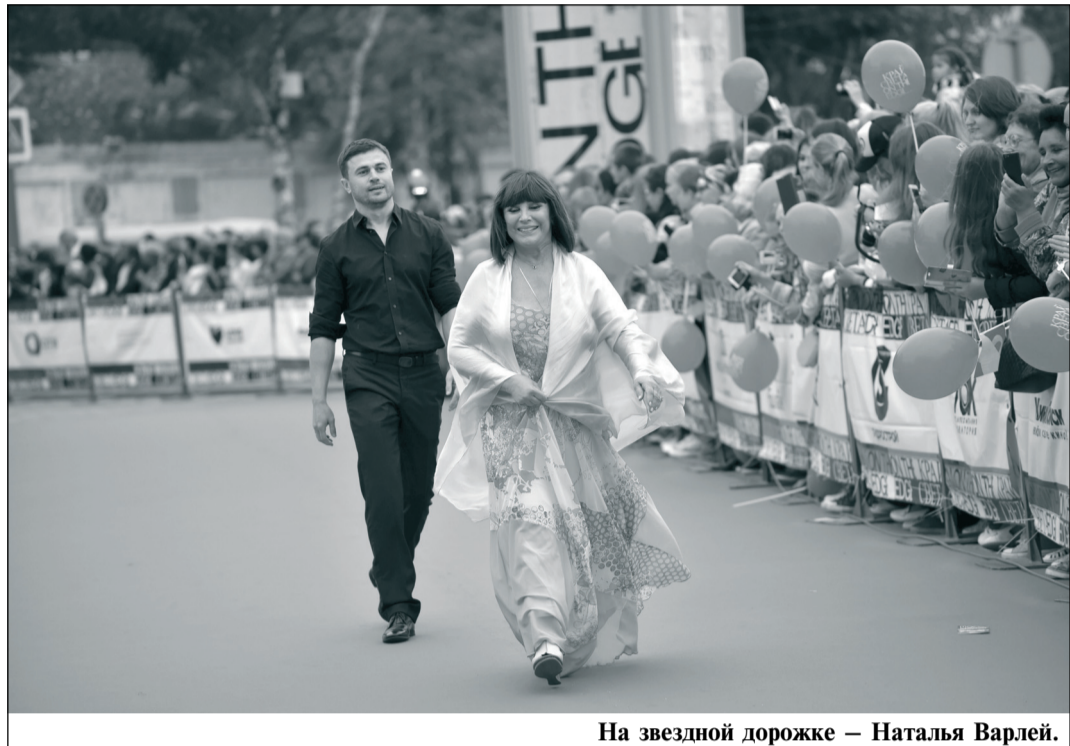
На звездной дорожке — Наталья Варлей.