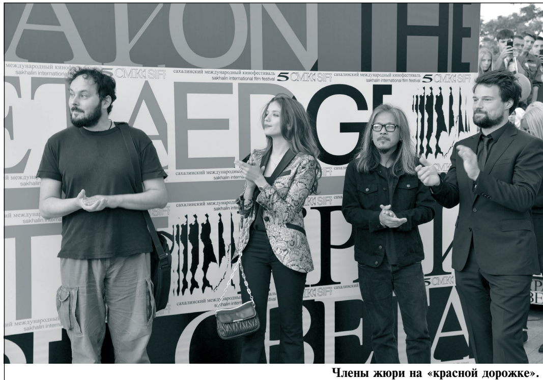
Члены жюри на «красной дорожке».

Как и два предыдущих года, гран-при фестиваля и миллион рублей в придачу ушли за рубеж. В этот раз фортуна была благосклонна к фильму режиссера Дениз Гамзе Эрговен (Турция) «Мустанг», в котором жюри усмотрело «цельное высказывание о важности свобод-