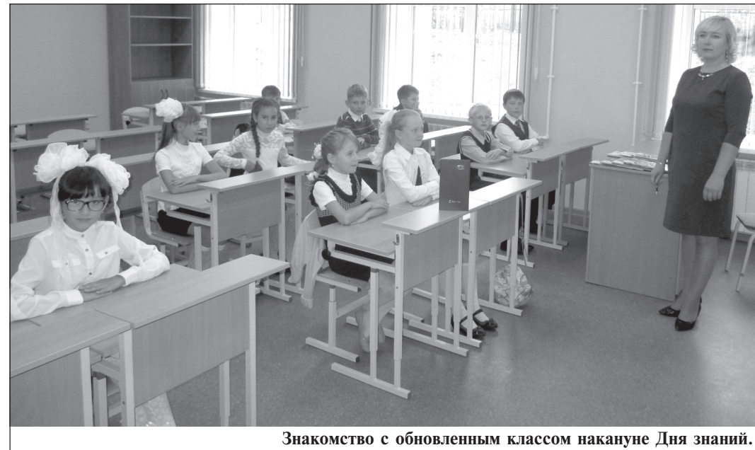
Знакомство с обновленным классом накануне Дня знаний.

После капитального ремонта школа № 2 Корсакова открыла двери для 500 учащихся