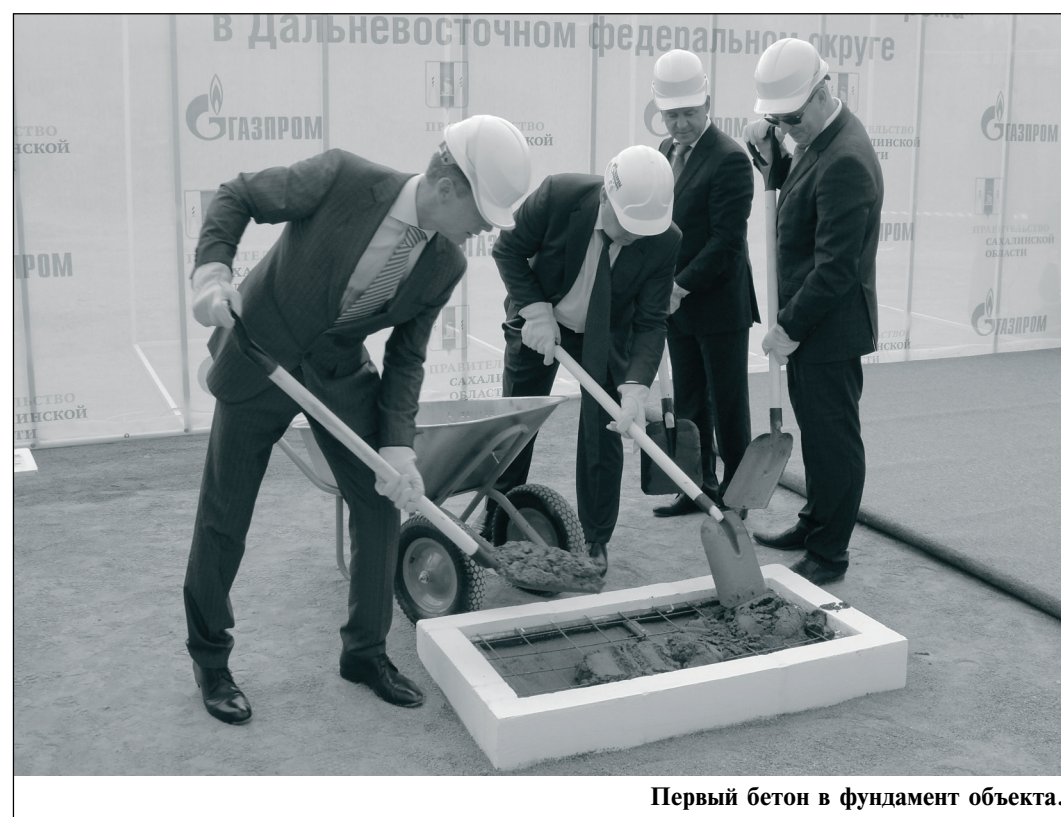
Первый бетон в фундамент объекта.

Соглашения о сотрудничестве с газовиками заключили ОАО «Сахалинавтотранс», МУП «Транспортная компания», МБУ «Зеленый город». Проявляют интерес другие предприятия. В декабре на Сахалин поступят 30 автобусов, использующих компримированный природный газ в качестве моторного топлива. Затем еще 80 единиц коммунальной техники. А к 2018 году планируется перевести на