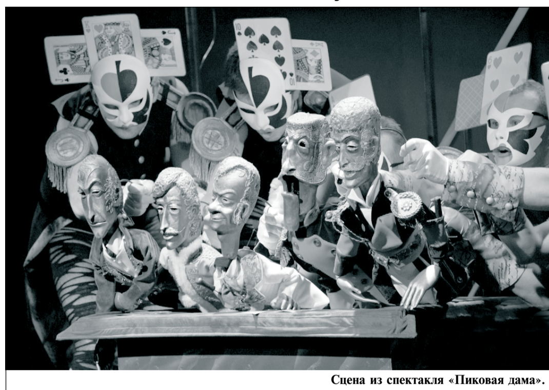
Сцена из спектакля «Пиковая дама».