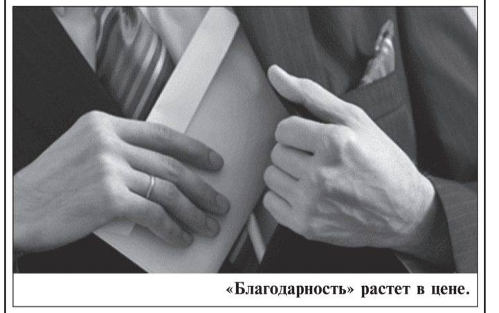
«Благодарность» растет в цене.