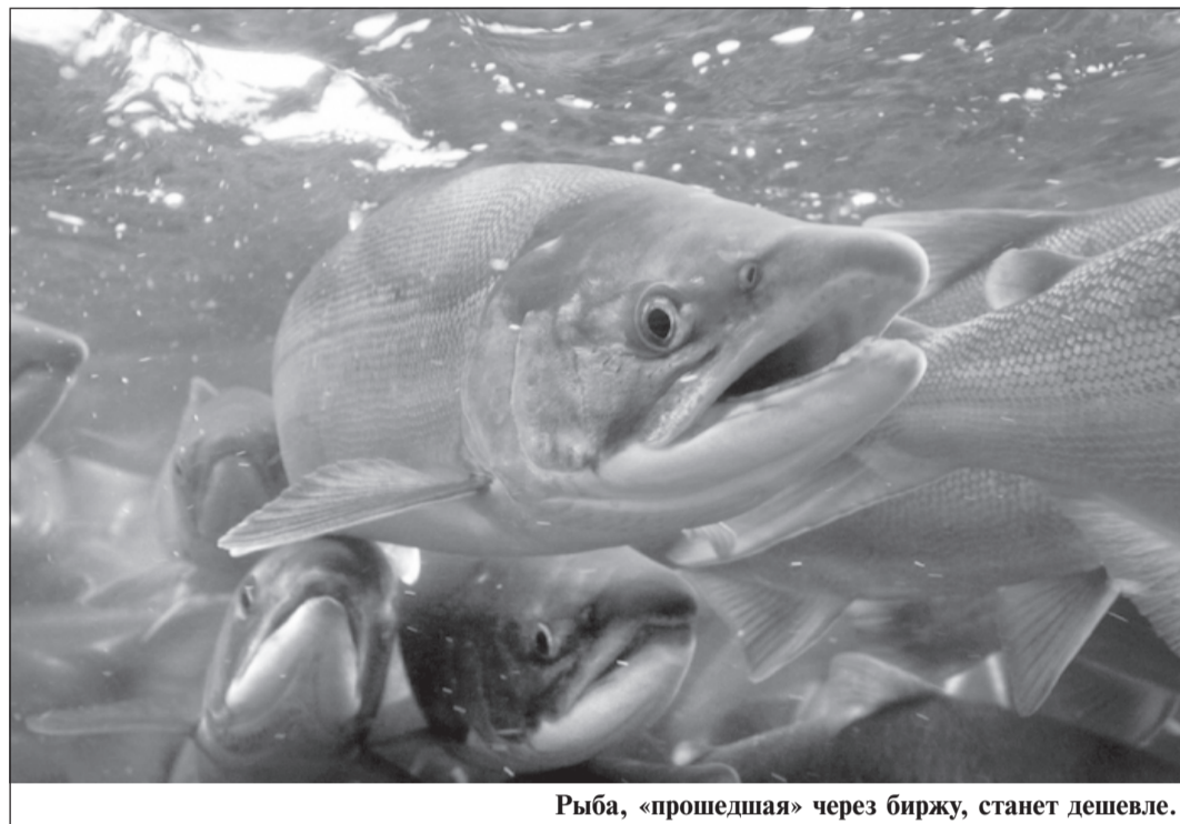
Рыба, «прошедшая» через биржу, станет дешевле.

Второй этап создания биржи — это выбор ее оператора, привлечение инвесторов и, самое затратное, создание инфраструктуры. Холодильник на 10 тыс. тонн, складские и офисные помещения, рыбопереработка и утилизация отходов. Все это планируется построить в 2017 году. Затраты составят около 3 млрд. рублей.