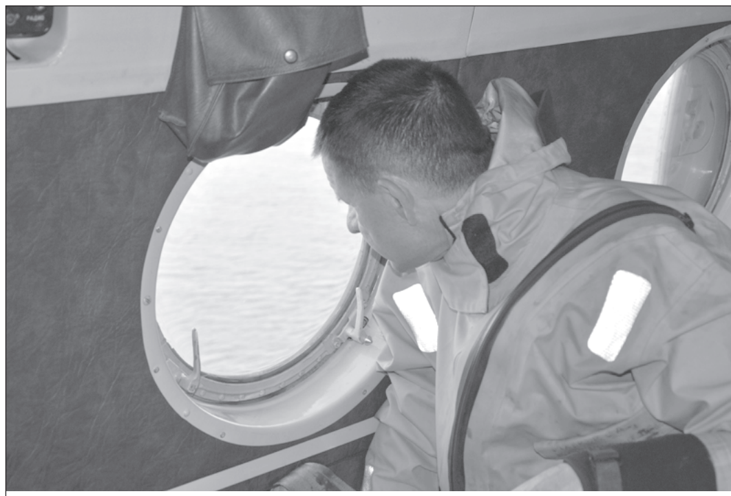
Поиски в районе крушения плшкоута «Парамушир» затруднены из-за штормовой погоды.

По данным портовых служб, «Парамушир» (судовладелец ООО «Сахморфлот», порт приписки Корсаков) совершал рейс из Северо-Курильска в Петропавловск-Камчатский. На борту находилось пять членов экипажа и тендеральный груз общим весом 117,11