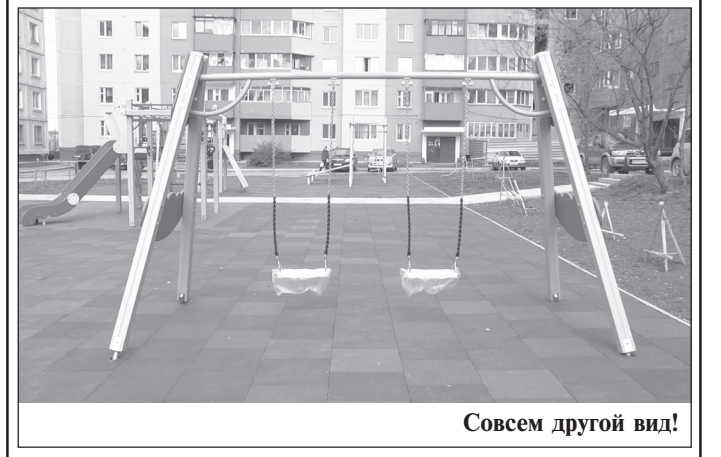
Совсем другой вид!