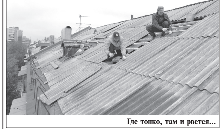
Где тонко, там и рвется...