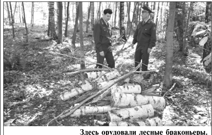
Здесь орудовали лесные браконьеры.

Примечание. Значительным размером признается ущерб, причиненный лесным насаждениям, исчисленный по утвержденным правительством Российской Федерации таксам, превышающий пять тысяч рублей (ст. 260, Уголовный кодекс Российской Федерации от 13.06.1996 № 63-ФЗ — ред. от 21.07.2011).