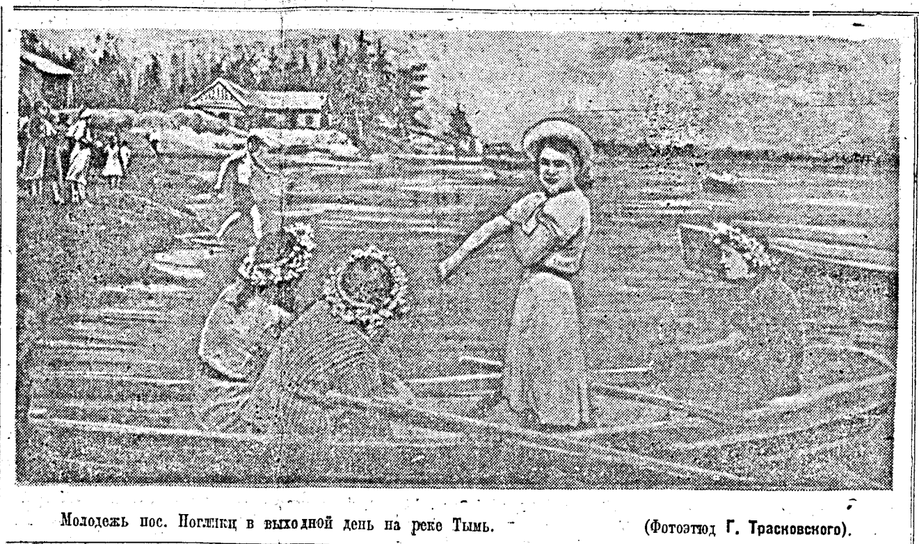
Молодежь пос. Погжик в выходной день на реке Тымь. (Фотоотд. Г. Трасновского).